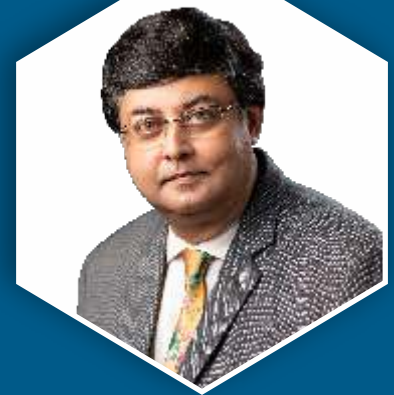
District Governor Sudip Mukherjee