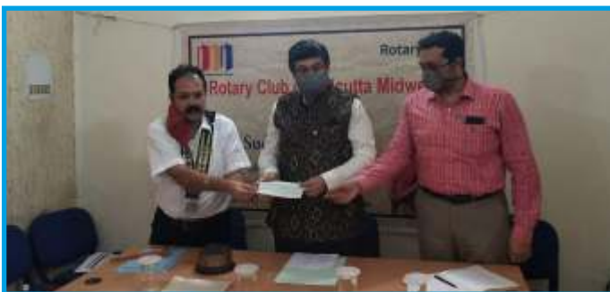
Rotary Club of Calcutta Mid West