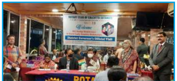
Rotary Club of Calcutta Sutanuti