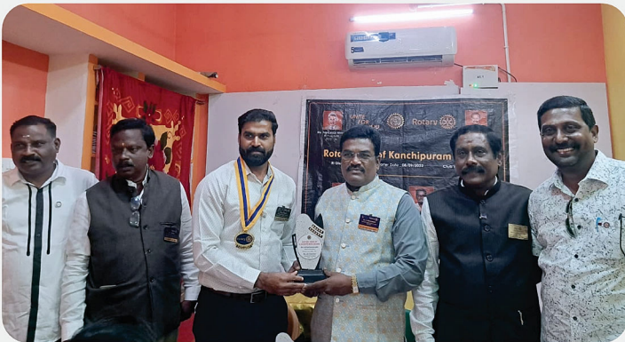
RC of Kanchipuram Grand