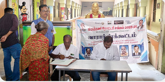
Eye Camp - RC of Tiruttani