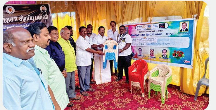
மாற்றுத்திறனாளி குழந்தைகளுக்கு இருக்கைகள் வழங்கும் நிகழ்வு - RC of Tirupattur Town