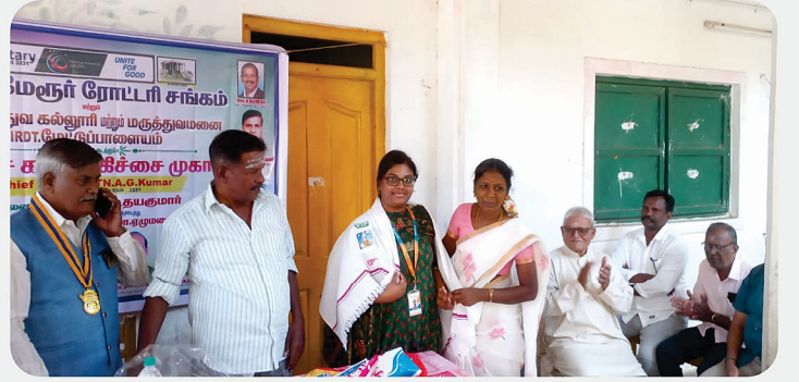
Eye Camp - RC of Uthiramerur