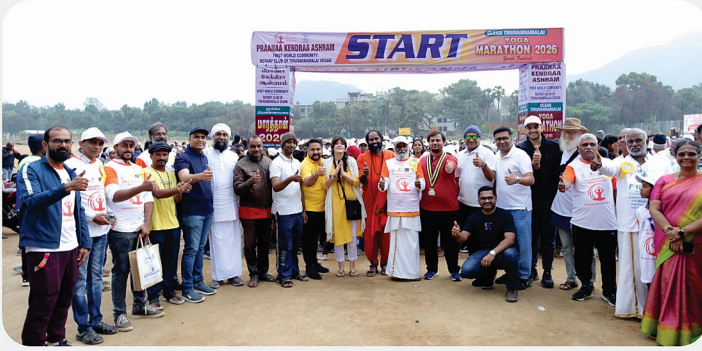
Grand Marathon for Clean Tiruvannamalai & Yoga Awareness - RC of Tiruvannamalai Vagan