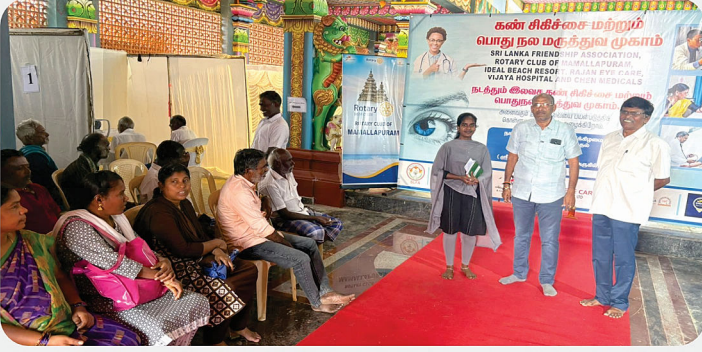
Eye Camp - RC of Mamallapuram