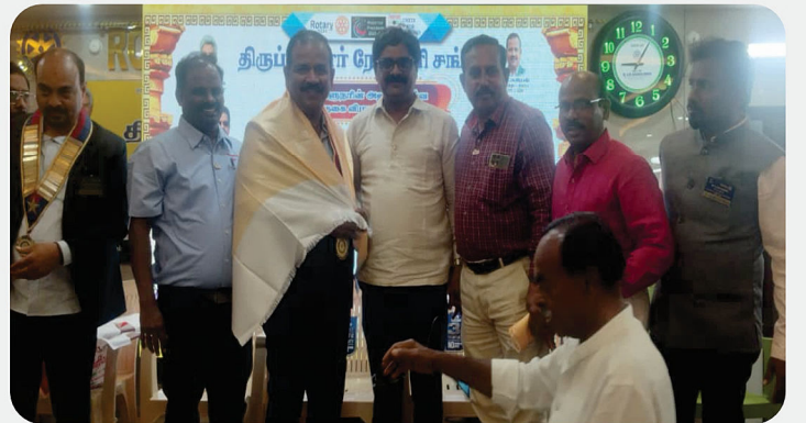
RC of Tirupattur