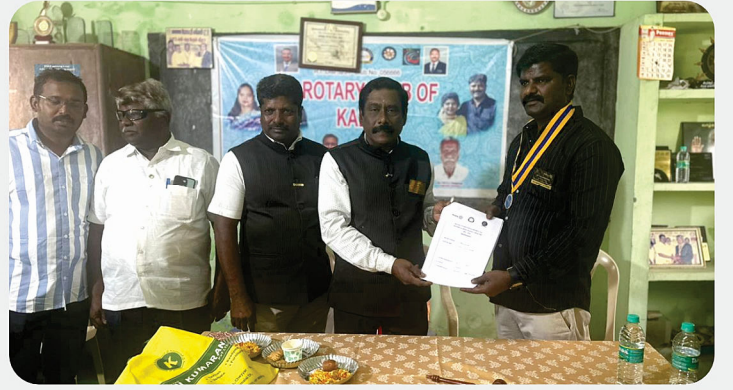
RC of Kalavai