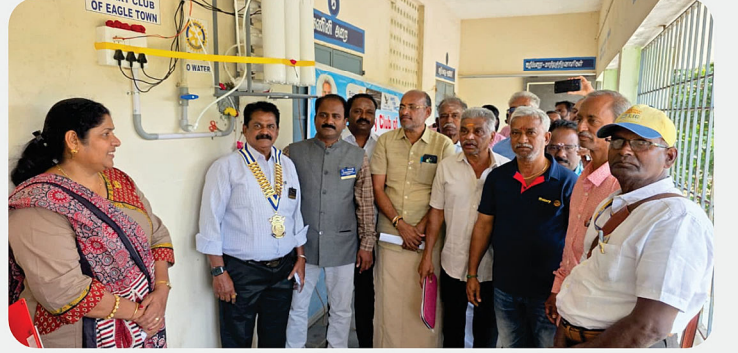
அரசு தொடக்கப்பள்ளி மற்றும் உயர்நிலைப்பள்ளிக்கு குடிநீர் சுத்திகரிப்பு இயந்திரம் வழங்கிய நிகழ்வு - RC of Eagle Town Tirukazhukundram