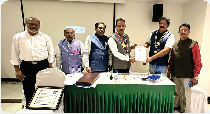
RC of Tiruvallur Royals