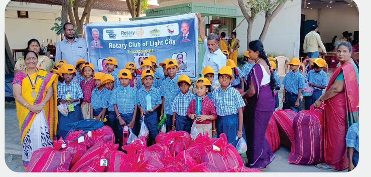
அரசு பள்ளி மாணவர்களுக்கு SCAW Kit வழங்கிய நிகழ்வு - RC of Light City Tiruvannamalai