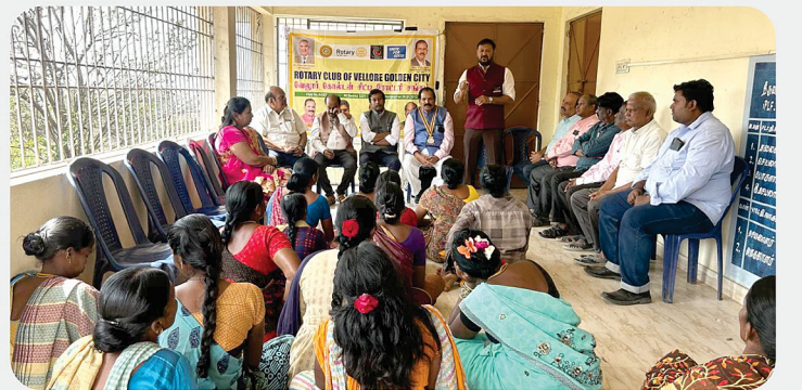
இலவச தையல் பயிற்சி துவக்க விழா @ பலாமரத்தூர், ஜவ்வாது மலை - RC of Vellore Golden City