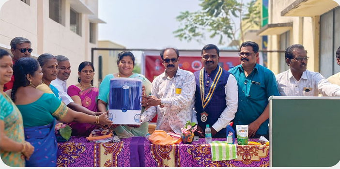
அரசு பள்ளிக்கு Green Board, Wash in Station, RO Purifier வழங்கும் நிகழ்வு - RC of Kanchipuram Temple City