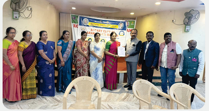
RC of Arakkonam Mithra