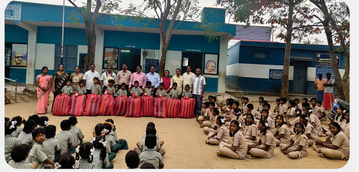
அரசு பள்ளி மாணவர்களுக்கு SCAW Kit, மேஜை, இடுக்கை வழங்கிய நிகழ்வு - RC of Tiruvannamalai Moon City