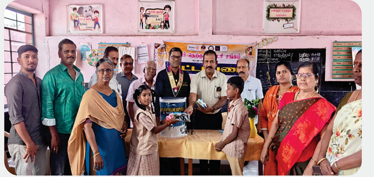
அரசு நடுநிலைப்பள்ளிக்கு பச்சை பலகை மற்றும் குடிநீர் சுத்திகரிப்பு இயந்திரம் வழங்கிய நிகழ்வு - RC of Vellore South