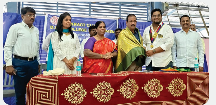
United for Peace with Yoga & Meditation @ Vellore RC of Vellore Accord