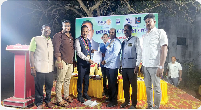
RC of Ranipet Sipcot