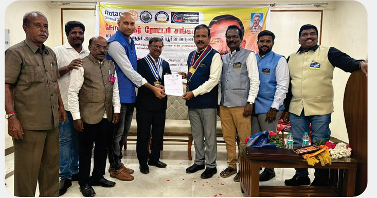
RC of Sholinghur