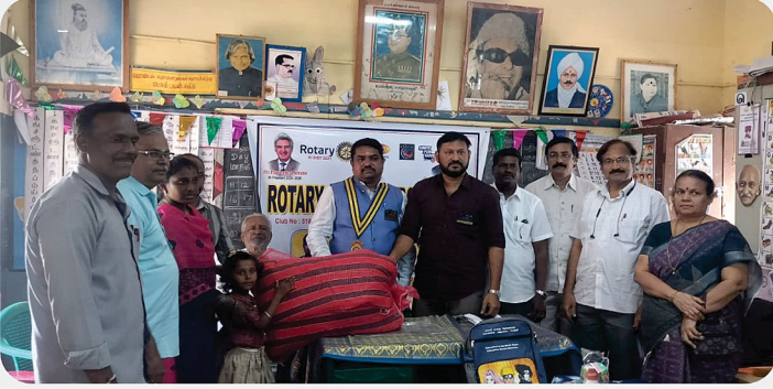
அரசு பள்ளி மாணவர்களுக்கு SCAW Kit வழங்கிய நிகழ்வு - RC fo Arcot East