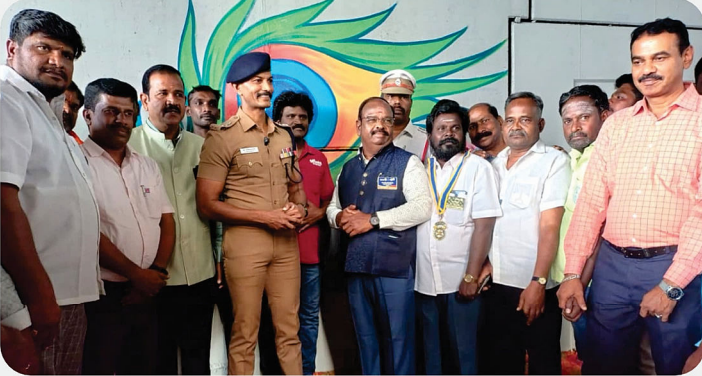
தேசிய நெடுஞ்சாலை மேம்பாலத்திற்கு வர்ணம் பூசும் நிகழ்வின் தொடக்க விழா - RC of Pallikonda