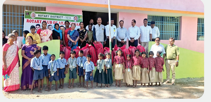
அரசு பள்ளி மாணவர்களுக்கு SCAW Kit வழங்கிய நிகழ்வு - RC fo Arakonam