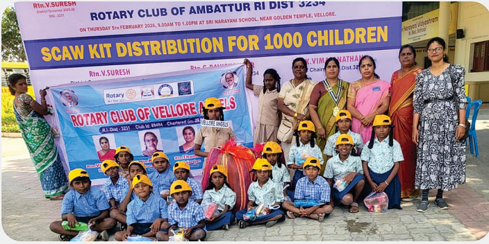
அரசு பள்ளி மாணவர்களுக்கு SCAW Kit வழங்கிய நிகழ்வு - RC of Vellore Angles