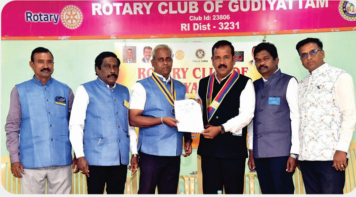
RC of Gudiyatham