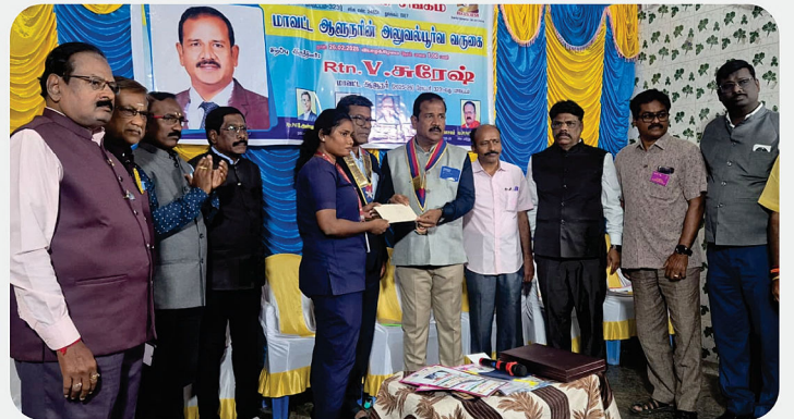
RC of Vellore South