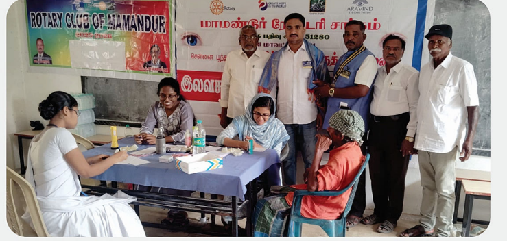
Eye Camp - RC of Mamandur