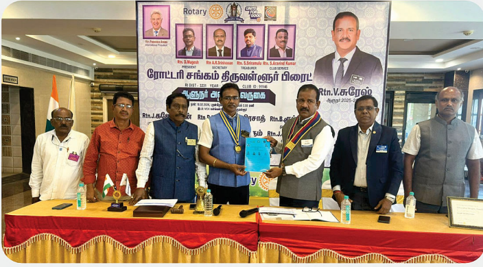
RC of Tiruvallur Bright