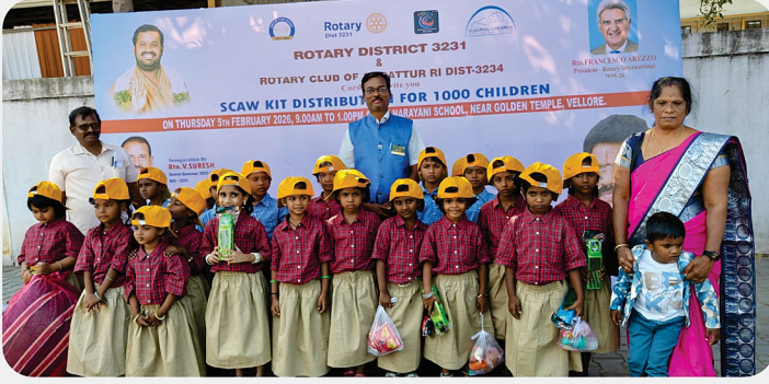
அரசு பள்ளி மாணவர்களுக்கு SCAW Kit வழங்கிய நிகழ்வு - RC of Tiruttani