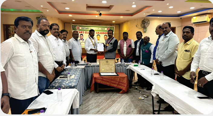
RC of Arakkonam