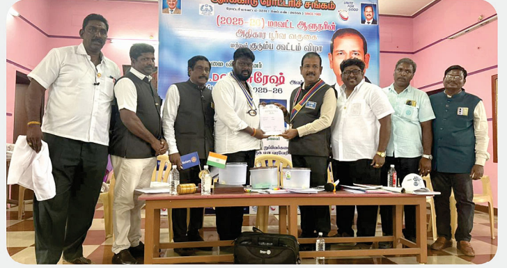
RC of Arcot