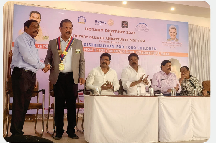
RI District 3231 & RC of Ambattur RI District 3234 Organized SCAW Kit Distribution for 1000 Children @ Sri Narayani School, Vellore