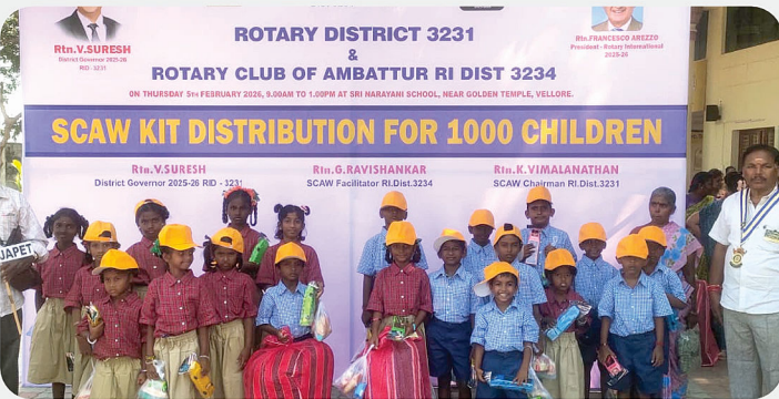
அரசு பள்ளி மாணவர்களுக்கு SCAW Kit வழங்கிய நிகழ்வு - RC of Walajapat