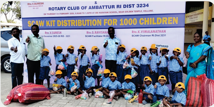
அரசு பள்ளி மாணவர்களுக்கு SCAW Kit வழங்கிய நிகழ்வு - RC of Vandavasi