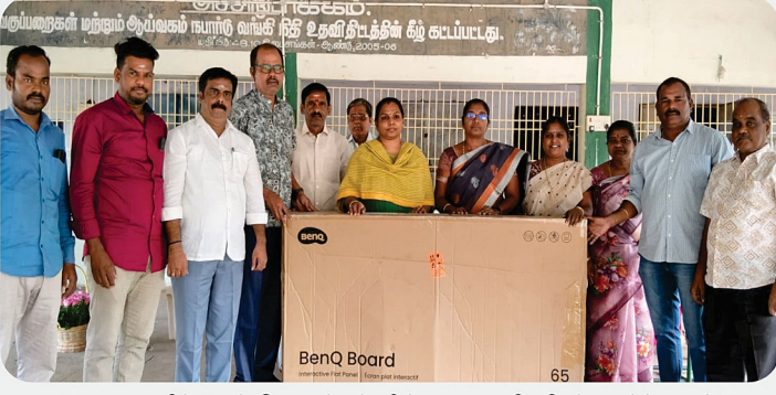
அரசு மகளிர் மேல்நிலைப்பள்ளிக்கு கணினி ஸ்மார்ட் போர்டு வழங்கிய நிகழ்வு - RC of Acharapakkam