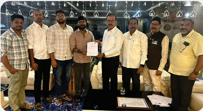
RC of Chengam