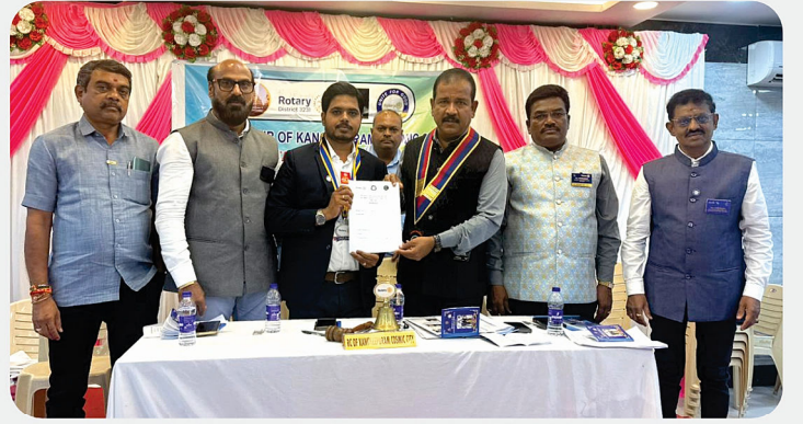
RC of Kanchipuram Cosmic City