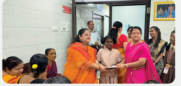
வெண்களுக்கான தனிப்பட்ட சர்வீக்கல் கேன்சர் மருத்துவ முகாம் - RC of Kanchi Infinity