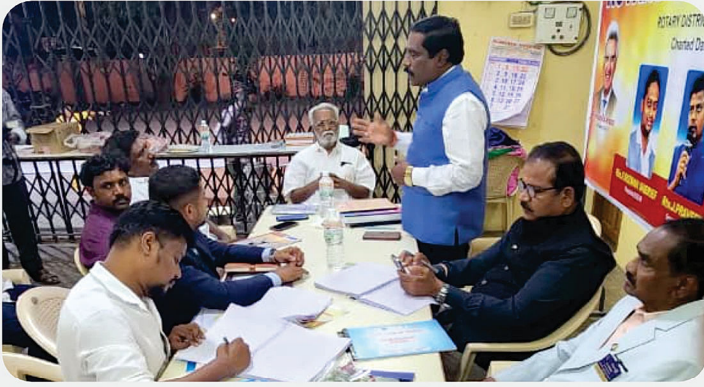
RC of Katpadi