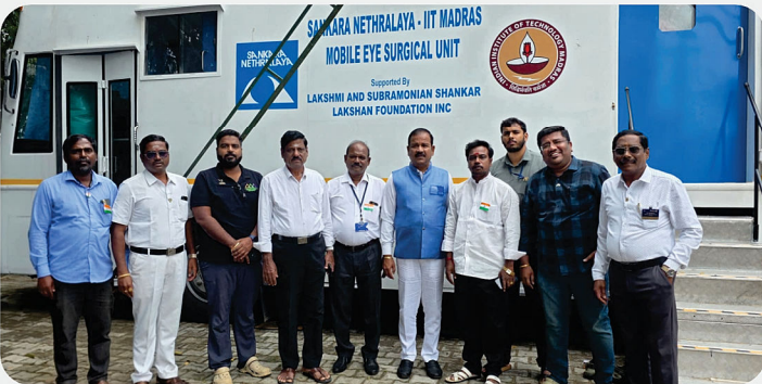
Mobile Surgery Eye Camp - RC of Kanchipuram Grand