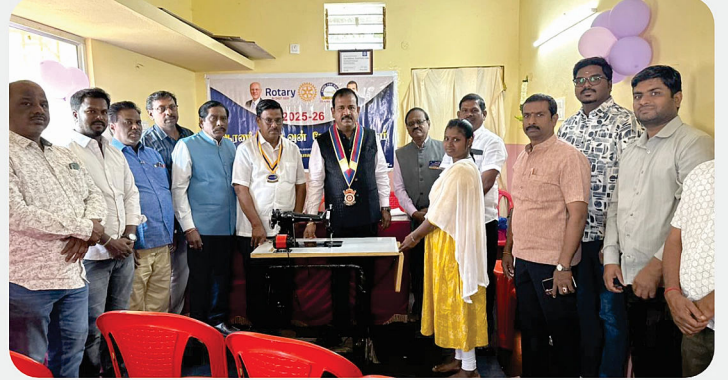
RC of Arni Midtown