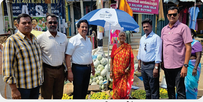
சாலையோர வியாபாரிக்கு நிழற்குடை வழங்கிய நிகழ்வு - RC of Kanchipuram