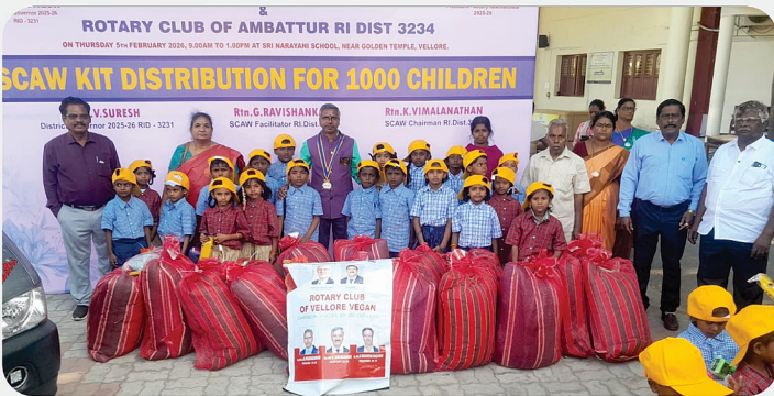
அரசு பள்ளி மாணவர்களுக்கு SCAW Kit வழங்கிய நிகழ்வு - RC of Vellore Vegan