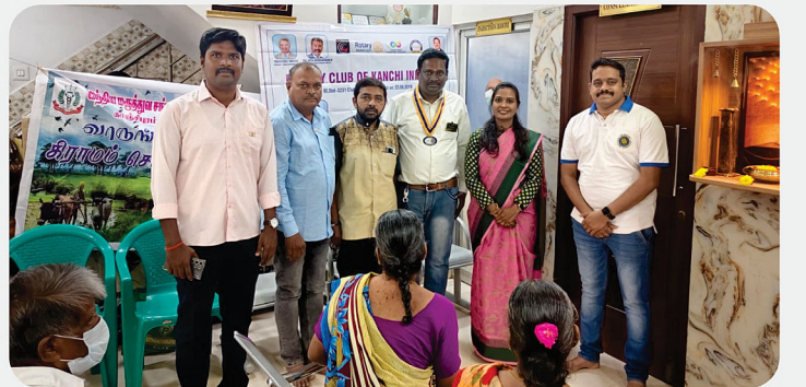
Eye Camp - RC of Kanchi Infinity