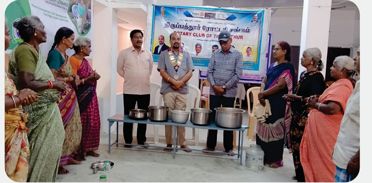
அழுத சுரபி அன்னதான திட்டம் - RC of Tirupattur