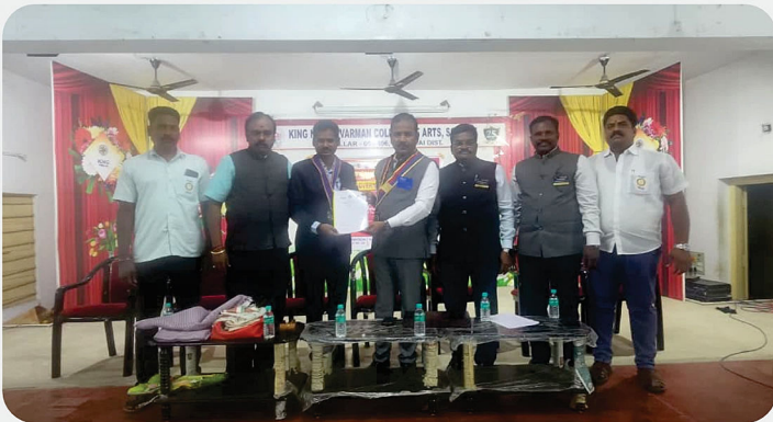
RC of Thellar