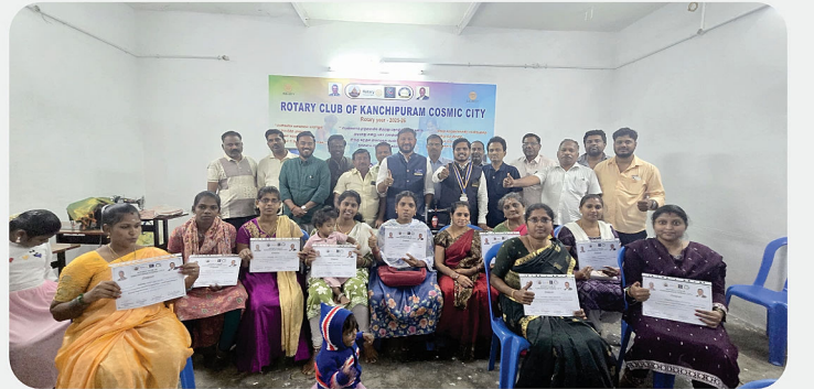
தையல் பயிற்சி நிறைவு செய்த பெண்களுக்கு சான்றிதழ் வழங்கிய நிகழ்வு - RC of Kanchipuram Cosmic City