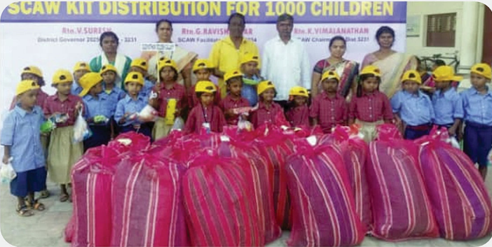
அரசு பள்ளி மாணவர்களுக்கு SCAW Kit வழங்கிய நிகழ்வு - RC fo Gudiyatham Golden Galaxy