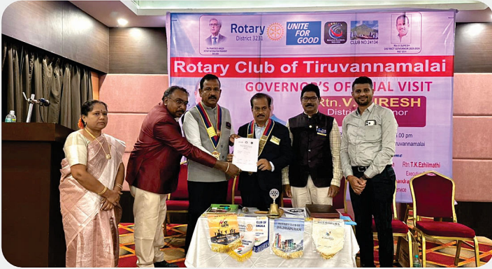
RC of Tiruvannamalai