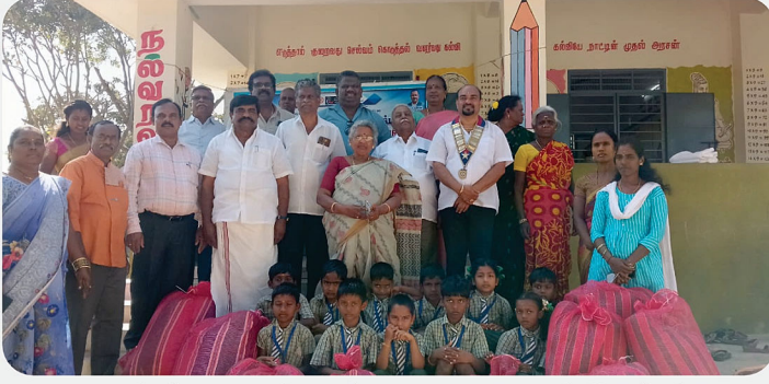
அரசு பள்ளி மாணவர்களுக்கு SCAW Kit வழங்கிய நிகழ்வு - RC of Tirupattur