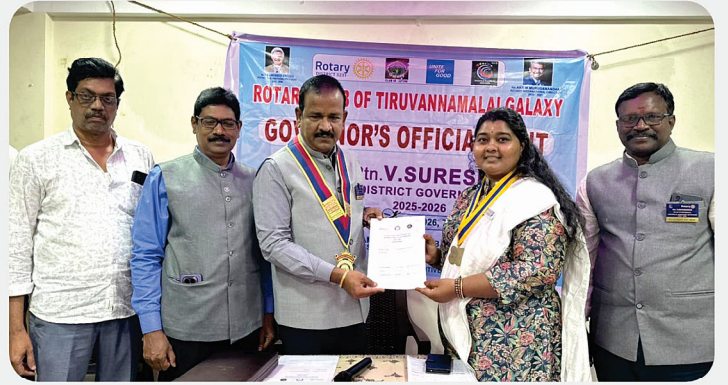
RC of Tiruvannamalai Galaxy