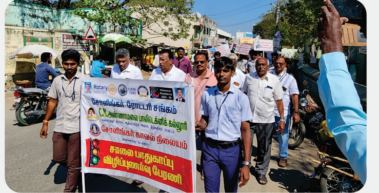
சாலை பாதுகாப்பு விழிப்புணர்வு பேரணி - RC of Sholinghur