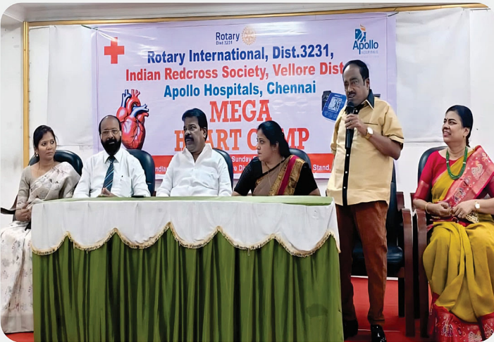
Rotary International District 3231 and Indian Redcross Society organized Mega Heart Camp @ Vellore.