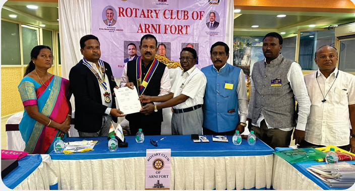
RC of Arni Fort