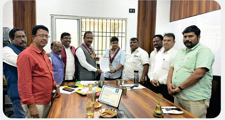
RC of Tiruvallur Elite