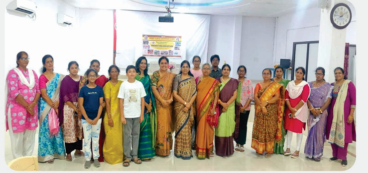
Women Empowerment & Vocational Service Promotion Exhibition @ Arakkonam - RC of Arakkonam Mithra