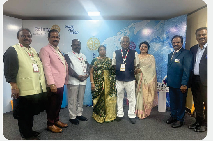
Rotary District 3234 Conference - UTSAV'26 @ Chennai Trade Centre