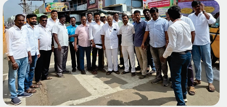
வோதைப் பொருட்களுக்கு எதிரான சமூக விழிப்புணர்வு ஊர்வலம் - RC of Vandavasi Town