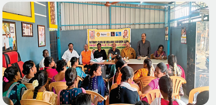
ஆரி மற்றும் எம்ப்ராண்டரி தையற்கலை இலவச பயிற்சி ஆரம்ப விழா - RC of Vellore Golden City