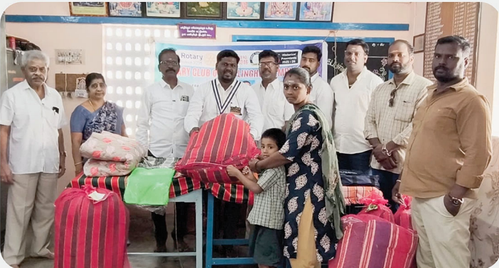
அரசு பள்ளி மாணவர்களுக்கு SCAW Kit வழங்கிய நிகழ்வு - RC of Sholinghur Temple City