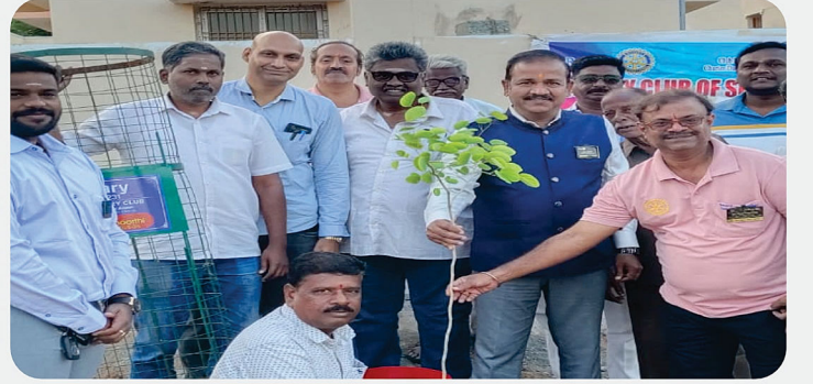
மரக்கன்று நட்டம் விழா - RC of Sholinghur