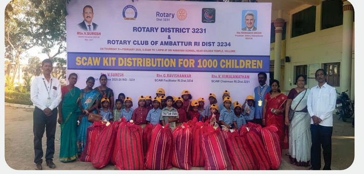
அரசு பள்ளி மாணவர்களுக்கு SCAW Kit வழங்கிய நிகழ்வு - RC of Tiruttani Stars