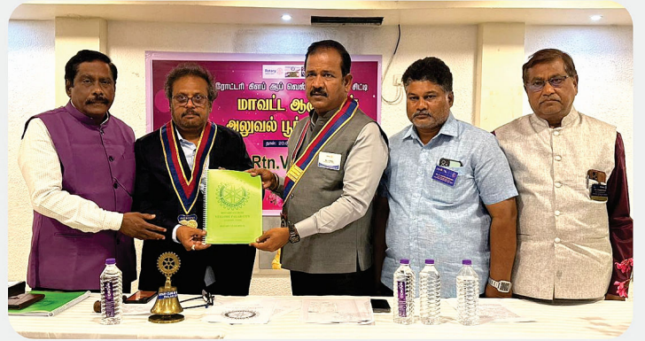
RC of Vellore Palar City