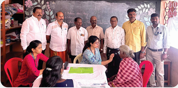
Eye Camp -RC of Vellore Midtown