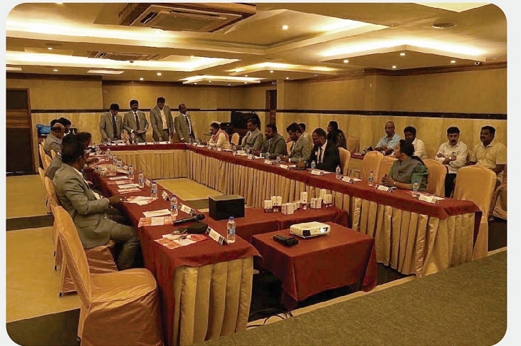
Rotary Means Business Fellowship (RMBF) Mega Visitors Day @ Vellore.