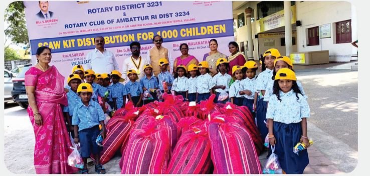
அரசு பள்ளி மாணவர்களுக்கு SCAW Kit வழங்கிய நிகழ்வு - RC of Vellore East