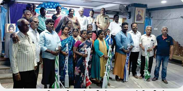
சாலையோர வியாபாரிகளுக்கு நிழற்குடை வழங்கிய நிகழ்வு - RC of Eagle Town Tirukazhukundram