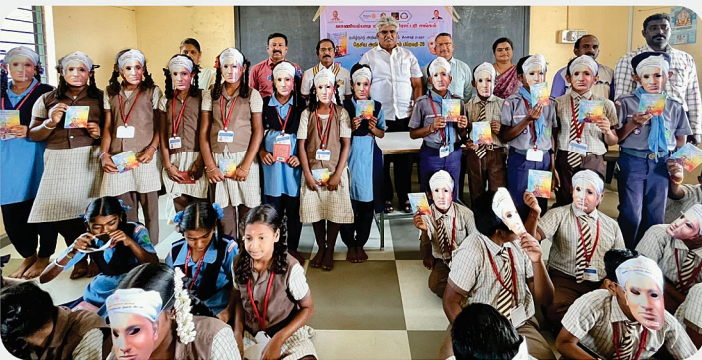
மெட்ரிகுலேஷன் பள்ளியில் நடைபெற்ற மாபெரும் தேசிய அறிவியல் தினம் - RC of Vaniyambadi Midtown