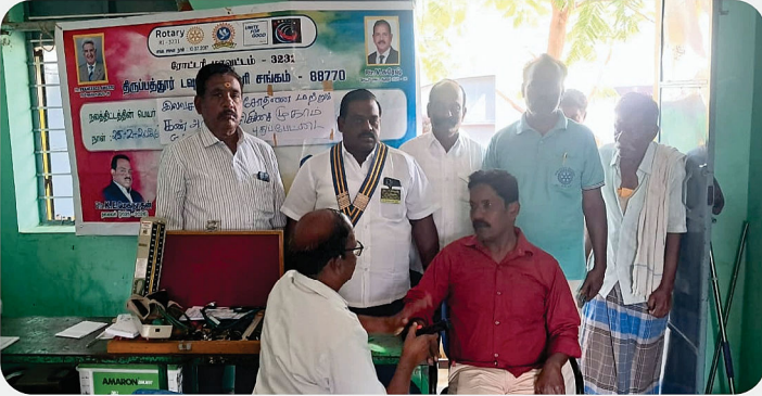
Eye Camp - Tirupattur Town