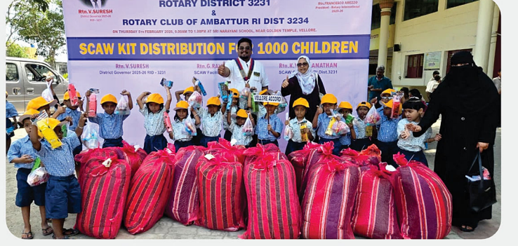
அரசு பள்ளி மாணவர்களுக்கு SCAW Kit வழங்கிய நிகழ்வு - RC of Vellore Accord