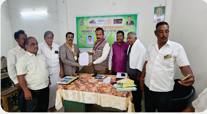
RC of Acharapakkam