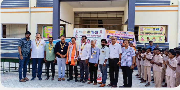
பள்ளி மாணவர்களுக்கு ரூ.20,000/- மதிப்புள்ள நோட்புக், பேனா, பென்சில், இருக்கைகள் வழங்கும் நிகழ்வு - All Rotary Clubs, Vellore