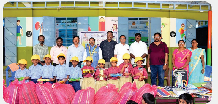
அரசு பள்ளி மாணவர்களுக்கு SCAW Kit வழங்கிய நிகழ்வு - RC of Vaniyambadi Midtown