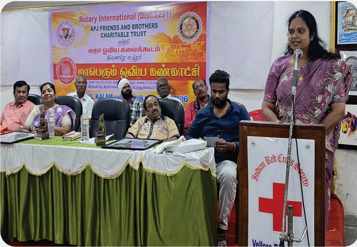
மாபெரும் ஓவிய கண்காட்சி @ இந்தியன் ரெட் கிராஸ் சொசைட்டி, வேலூர்.