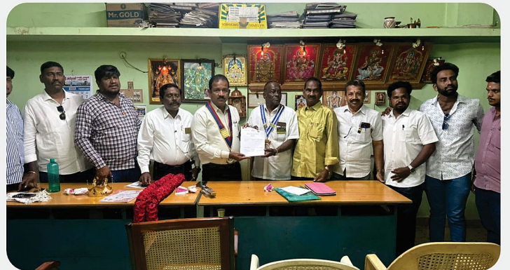
RC of Gudiyatham Golden Galaxy