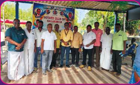
RC KALALKURICHI Annadhanams