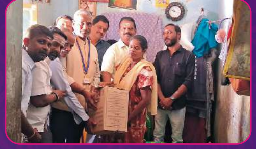
RC ULUNDURPET Treatment Fund Donated