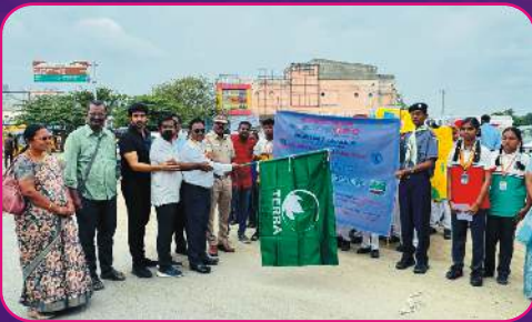
RC KRISHNAGIRI Awareness Rally