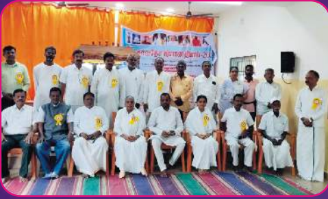
RC VILLUPURAM Yoga Day Celebration