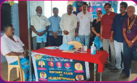
RC JALAGANDAPURAM Medical Camp