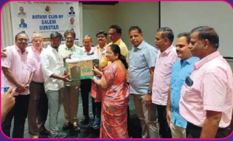
RC SALEM SUNSTAR computer Donatation