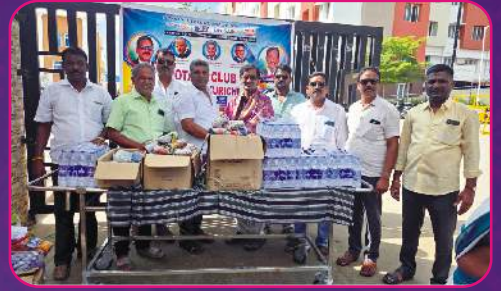
RC KALLAKURICHI Annadhanam