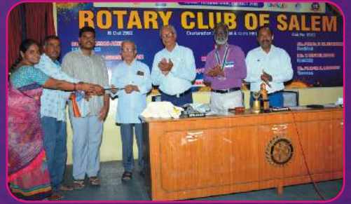
RC SALEM Education Fund Donation