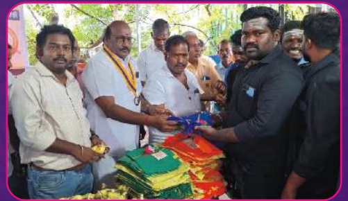
RC THIYAGATHUGAM Dress Donation