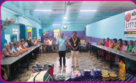
RC SALEM TEXTCITY Dresses Donated