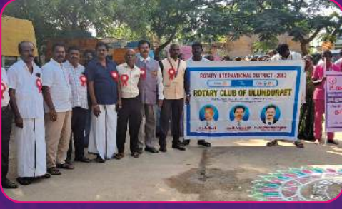
RC ULUNDURPET Awareness Rally