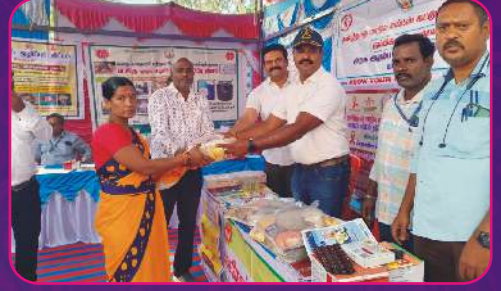
RC HOSUR ROYALS Nutrition Kit Donation