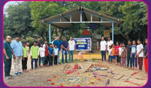
RC KOMARAPALAYAM Sports Materials Donated