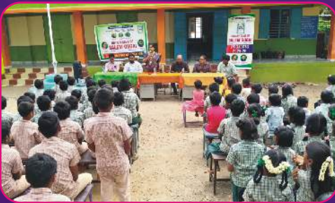
RC SALEM GUGAI Children's Day Celebration