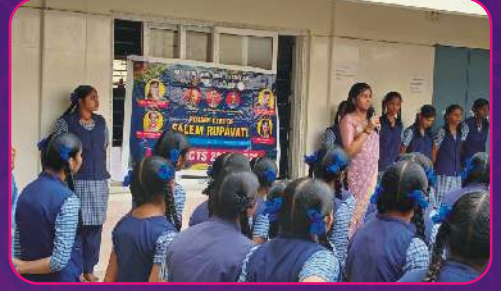
RC SALEM RUPAVATI Cyber Awareness