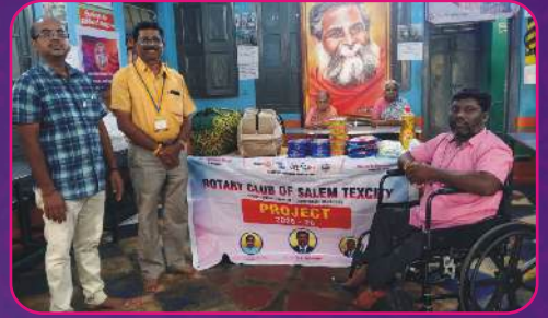
RC SALEM TEXTCITY Donated Grocery item to Old Age Home