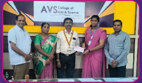
RC SALEM TEXTCITY Education Aid