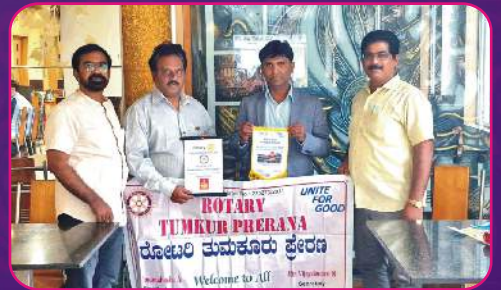
RC KRISHNAGIRI Flag Exchange