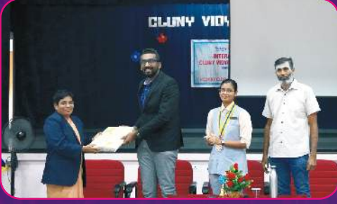
RC SALEM METROPOLIS Skill Development to School Students