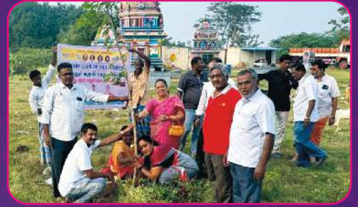
RC VILLUPURAM Tree Plantation