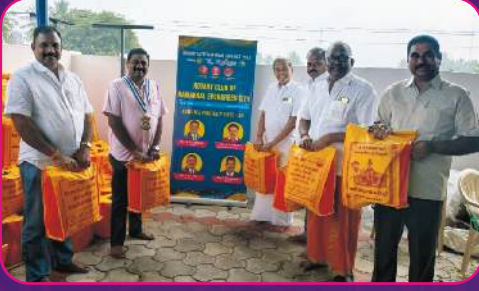
RC NAMAKKAL EVERGREEN CITY Cloth Bags for Devotees