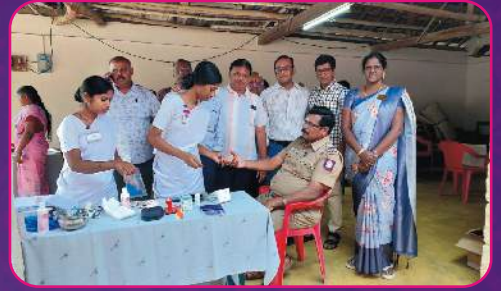
RC SALEM EAST Medical Camp