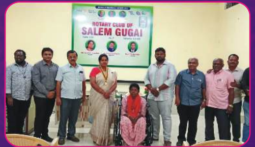
RC SALEM GUGAI Wheel Chair Donated