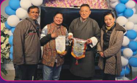
RC HOSUR ROYALS Flag Exchange