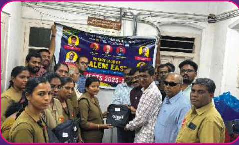
RC SALEM EAST Rain Coat Donated to Postmans