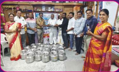
RC SALEM TEXTCITY Marriage Material Donation