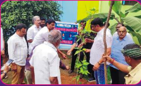
RC SALEM CITY Tree Plantation