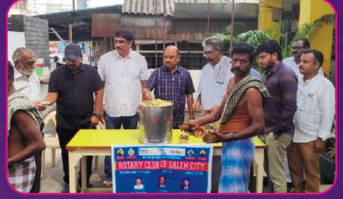
RC SALEM CITY Annadhanam