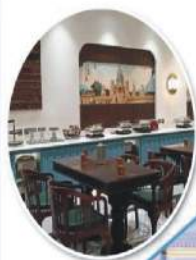
TABLE 360 24 HRS RESTAURANT