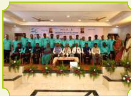
ROTARY CLUB OF PUDUKKOTTAI MIDTOWN