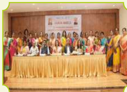
ROTARY CLUB OF KARUR ANGELS