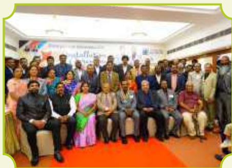
ROTARY CLUB OF KODAIKANAL