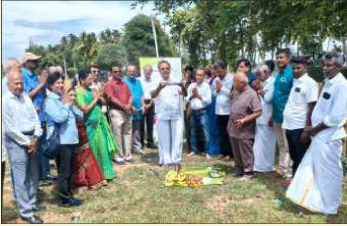
ROTARY CLUB OF MADURAI WEST AT KELADI POND RESTORATION