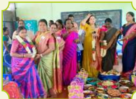
ROTARY CLUB OF PUDUKOTTAI MAHARANI