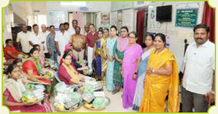
ROTARY CLUB OF MADURAI STAR