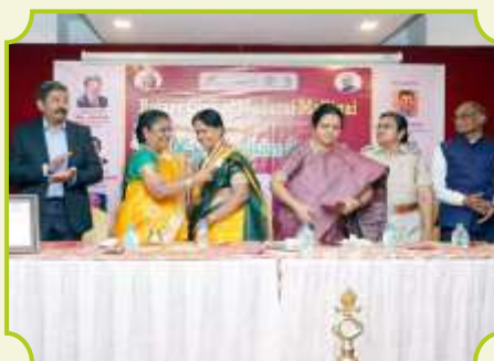
ROTARY CLUB OF MADURAI MALLIGAI