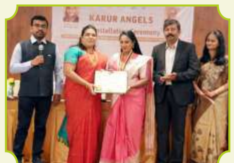
ROTARY CLUB OF KARUR ANGELS