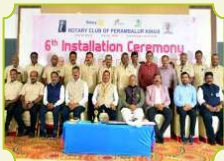
ROTARY CLUB OF PERAMBALUR KINGS