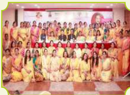
ROTARY CLUB OF MADURAI BLOSSOM