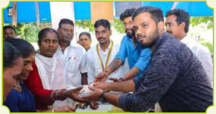
ROTARY CLUB OF GANDHARVAKOTTAI