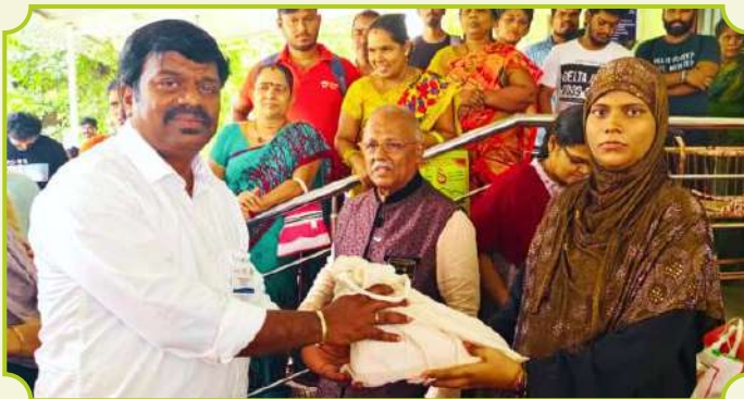
ROTARY CLUB OF MADURAI INNOVATORS