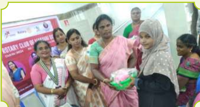
ROTARY CLUB OF MANAVAI QUEENS