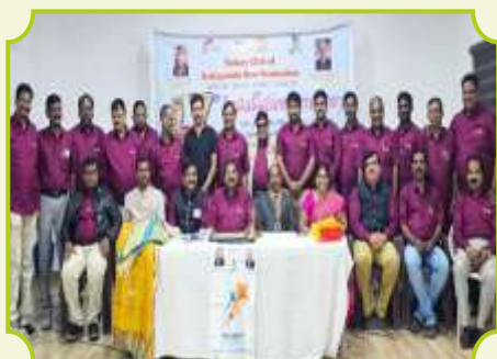
ROTARY CLUB OF BATLAGUNDU NEW GENERATION