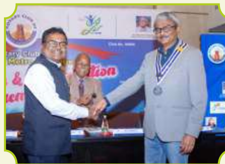
ROTARY CLUB OF MADURAI METRO HERITAGE