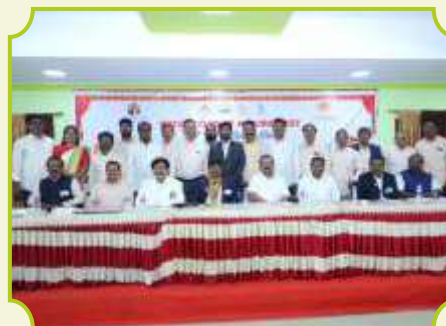
ROTARY CLUB OF MADURAI EAST