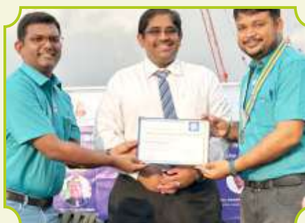
ROTARY CLUB OF MADURAI NEXT GEN