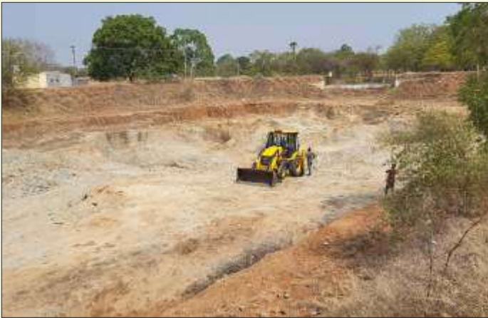
ROTARY CLUB OF ARAVAKURICHI AT R. VELLODU, PONNAMPATTI (BEFORE & AFTER REJUVENATION)