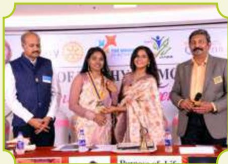
ROTARY CLUB OF TRICHY DIAMOND CITY QUEENS