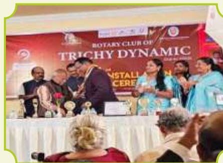
ROTARY CLUB OF TRICHY DYNAMIC