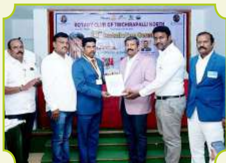
ROTARY CLUB OF TRICHIRAPALLI NORTH