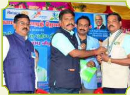
ROTARY CLUB OF GANDARVAKOTTAI BHARATH