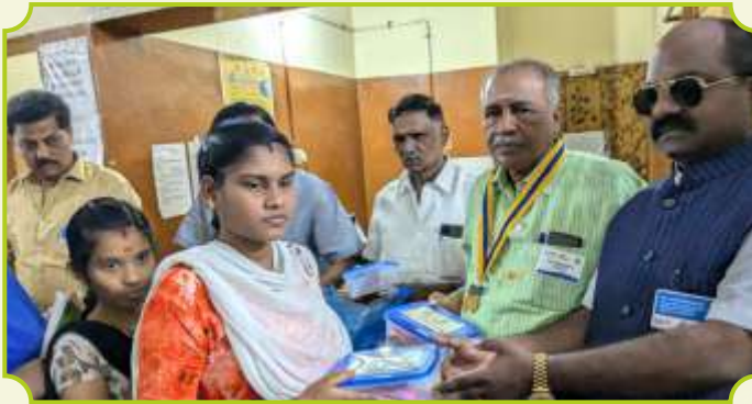
ROTARY CLUB OF CHINNAMANNUR