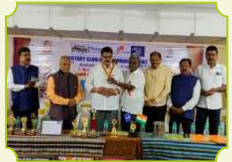
ROTARY CLUB OF THIRUMAYAM FORT