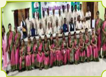
ROTARY CLUB OF MADURAI KINGS CITY