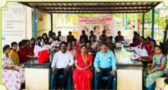
ROTARY CLUB OF THENI STARS