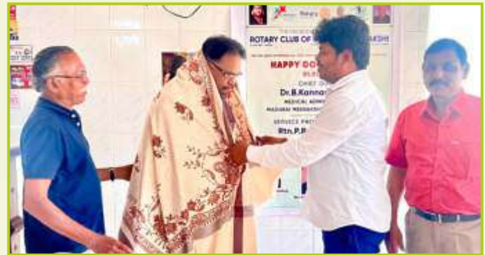
ROTARY CLUB OF MADURAI MEENAKSHI