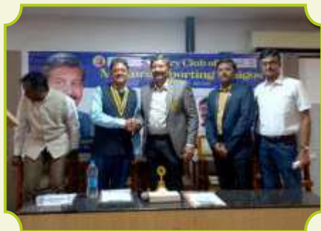
ROTARY CLUB OF SPORTING AMIGOS