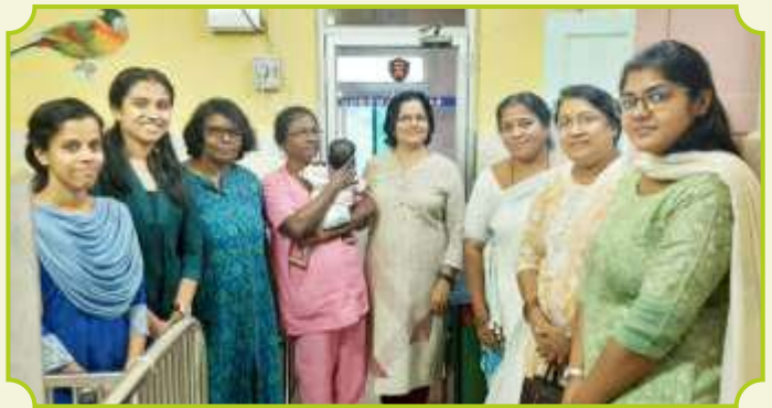
ROTARY CLUB OF MADURAI PHOENIX