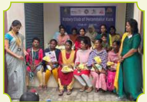
ROTARY CLUB OF PERAMBALUR AURA