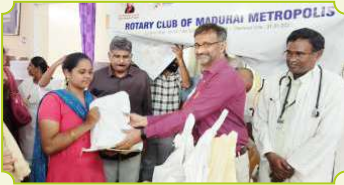
ROTARY CLUB OF MADURAI METROPOLIS