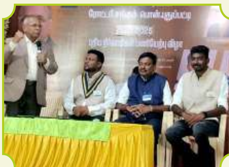
ROTARY CLUB OF PON PUTHUPPATTI