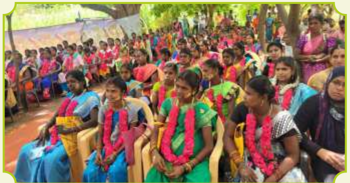
ROTARY CLUB OF DINDIGUL WEST