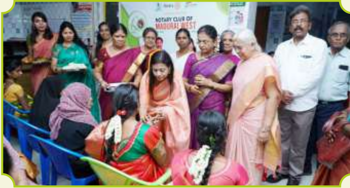
ROTARY CLUB OF MADURAI WEST