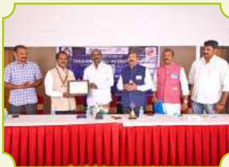
ROTARY CLUB OF TIRUCHIRAPALLI METROPOLITAN