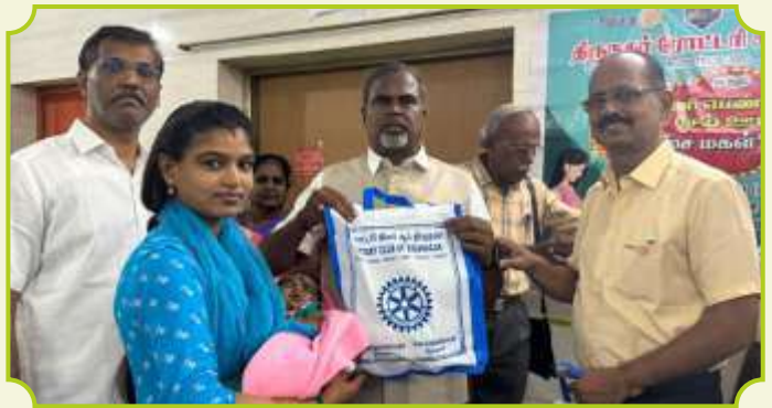
ROTARY CLUB OF THIRUNAGAR