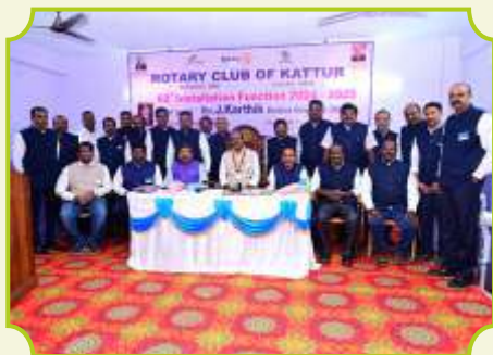
ROTARY CLUB OF KATTUR