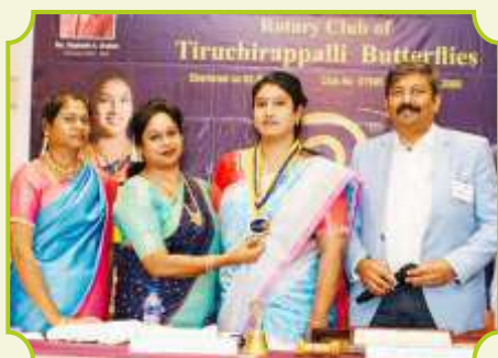
ROTARY CLUB OF TIRUCHIRAPALLI BUTTERFLIES