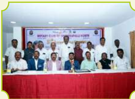
ROTARY CLUB OF TRICHIRAPALLI NORTH