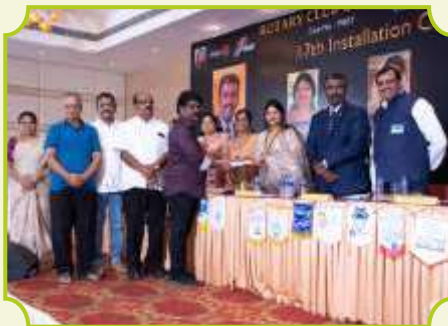
ROTARY CLUB OF THIRUCHIRAPALLI SAKTHI