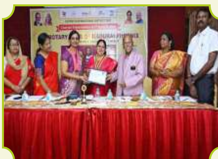
ROTARY CLUB OF MADURAI PHOENIX