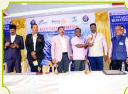
ROTARY CLUB OF MANAPARAI