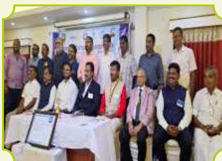
ROTARY CLUB OF PERAMBALUR COTTON CITY