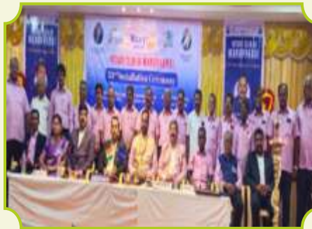
ROTARY CLUB OF MANAPPARAI