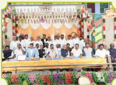
ROTARY CLUB OF CHINNAMANNUR GREENCITY