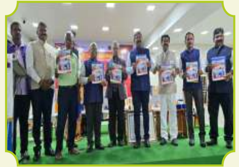
ROTARY CLUB OF PERAMBALUR