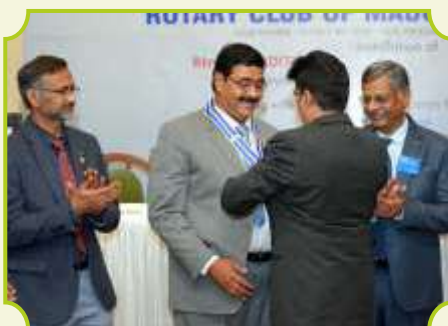
ROTARY CLUB OF MADURAI METROPOLIS