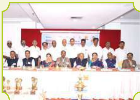
ROTARY CLUB OF MADURAI NORTH WEST