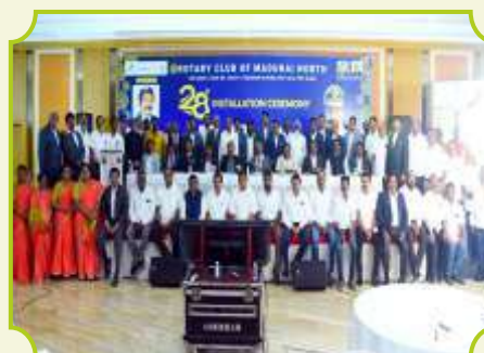
ROTARY CLUB OF MADURAI NORTH