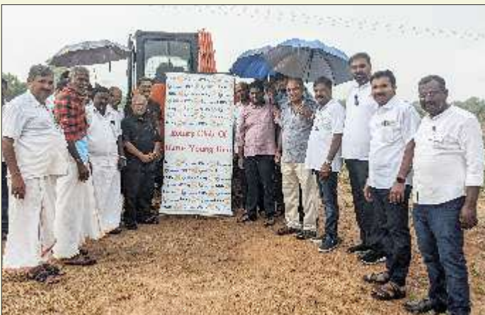
ROTARY CLUB OF KARUR YOUNG GEN & ROTARY CLUB OF KARUR WINGS