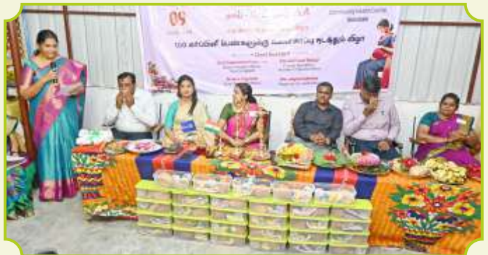
ROTARY CLUB OF TRICHY STARS