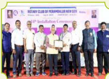
ROTARY CLUB OF PERAMBALUR NEW GEN