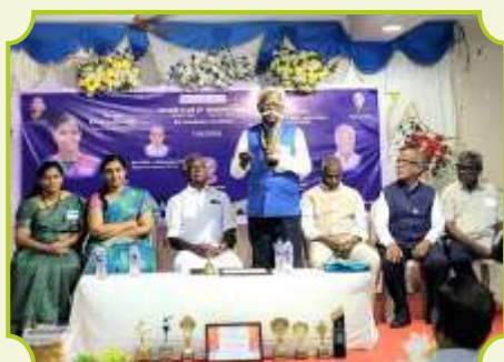
ROTARY CLUB OF MANAVAI KINGS