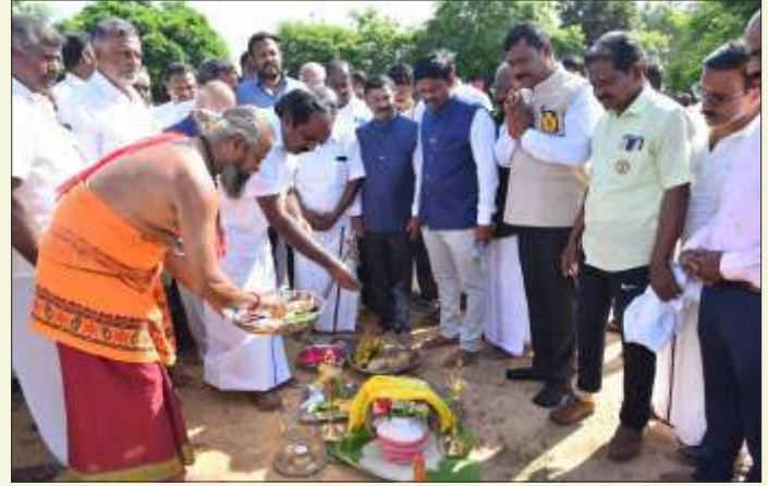
ROTARY CLUB OF ARANDAI FRIENDS AT SIRUVA LAKE