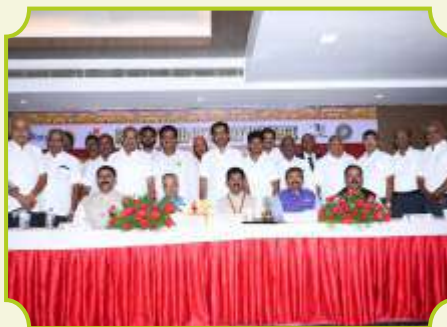
ROTARY CLUB OF TRICHY HERITAGE