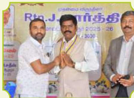
ROTARY CLUB OF GUDALUR GARDEN CITY