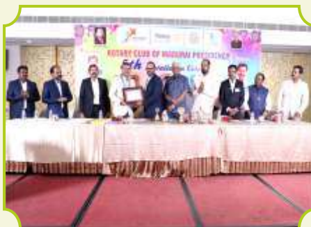
ROTARY CLUB OF MADURAI PRESIDENCY