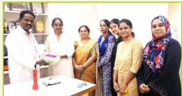
ROTARY CLUB OF TRICHY DIAMOND CITY QUEENS