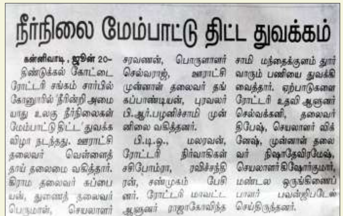
ROTARY CLUB OF DINDIGUL FORT