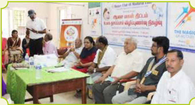
ROTARY CLUB OF MADURAI NORTH WEST AND ROTARY CLUB OF MADURAI ELITE