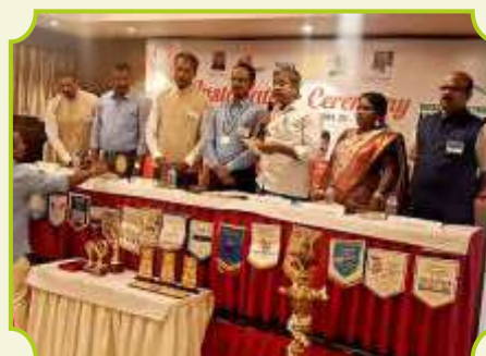
ROTARY CLUB OF TRICHY GEMS INNOVATORS