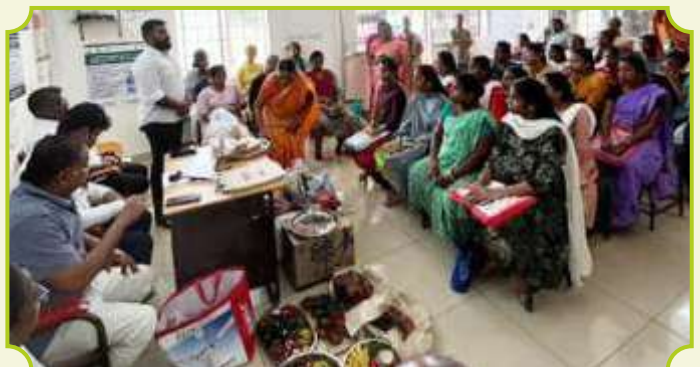
ROTARY CLUB OF MADURAI MEENAKSHI