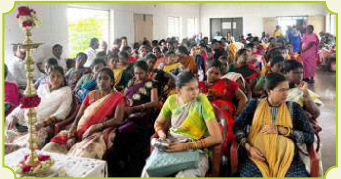
ROTARY CLUB OF MADURAI MALLIGAI, MADURAI EAST & MADURAI ROYAL