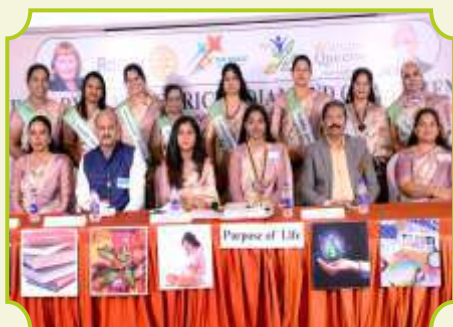
ROTARY CLUB OF TRICHY DIAMOND CITY QUEENS