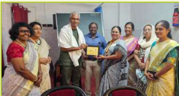
ROTARY CLUB OF MADURAI PHOENIX