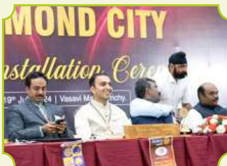
ROTARY CLUB OF TIRUCHIRAPALLI DIAMOND CITY