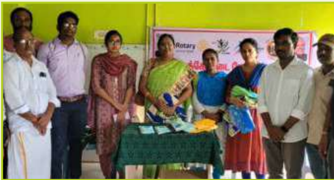
ROTARY CLUB OF GANDHARVAKOTTAI