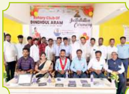
ROTARY CLUB OF DINDIGUL ARAM