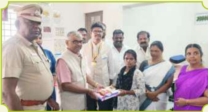
ROTARY CLUB OF MADURAI SANGAMAM