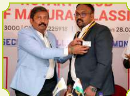
ROTARY CLUB OF MADURAI CLASSIC