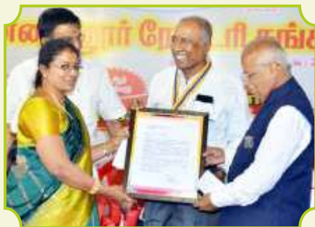
ROTARY CLUB OF CHINNAMANNUR