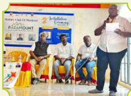
ROTARY CLUB OF MADURAI PARAMOUNT