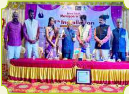
ROTARY CLUB OF MANAPARAI STAR