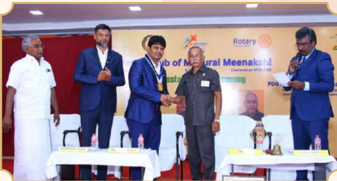
Rotary Club of Madurai Meenakshi