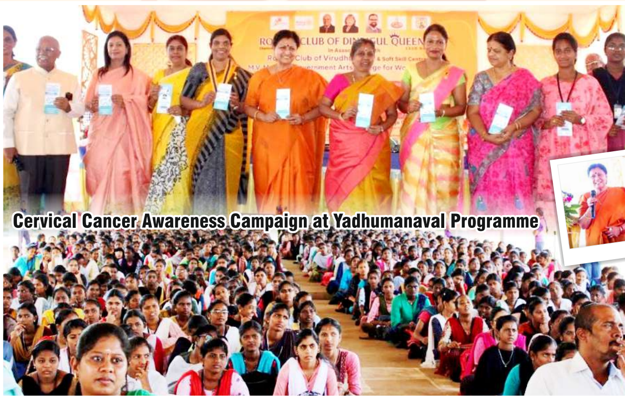
Cervical Cancer Awareness Campaign at Yadhumanaval Programme

The Management, the staff and the students of Madura College, MVM Govt. College of Arts for Women, and Mother Theresa Women's University are overjoyed by the conduct of this special programme in their premises. On its march towards a century, the Yadhumanaval Programme is a big hit everywhere. Thanks once again to the sponsors Idhayam.