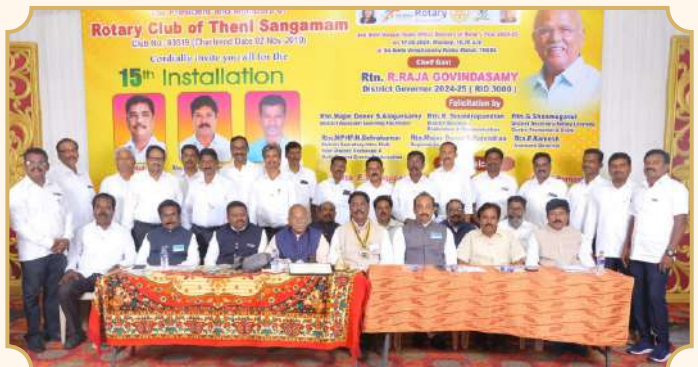
Rotary Club of Theni Sangamam