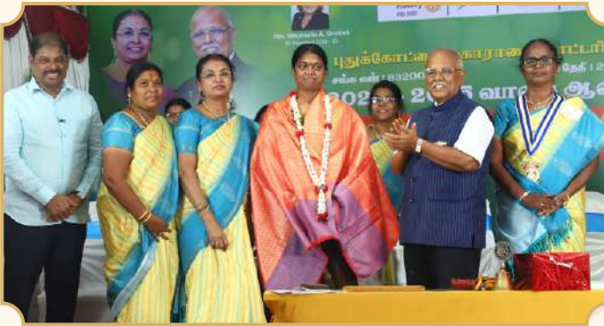
Rotary Club of Pudukottai Maharani