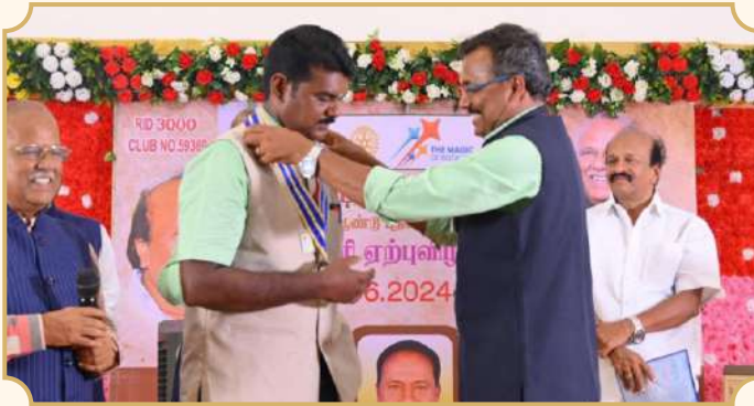
Rotary Club of Karambakudi