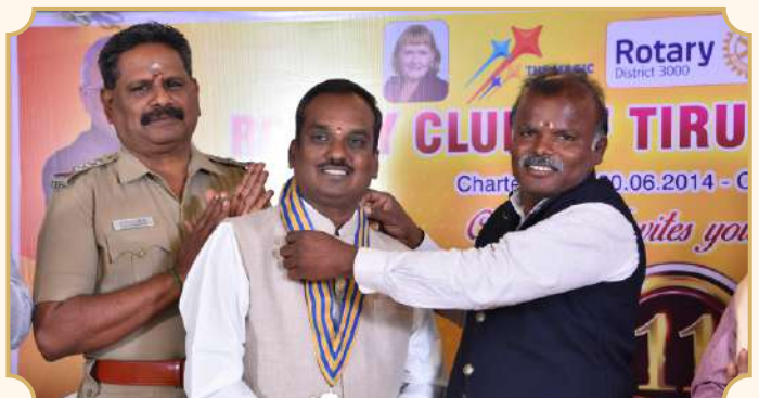
Rotary Club of Tiruchirapalli Royal