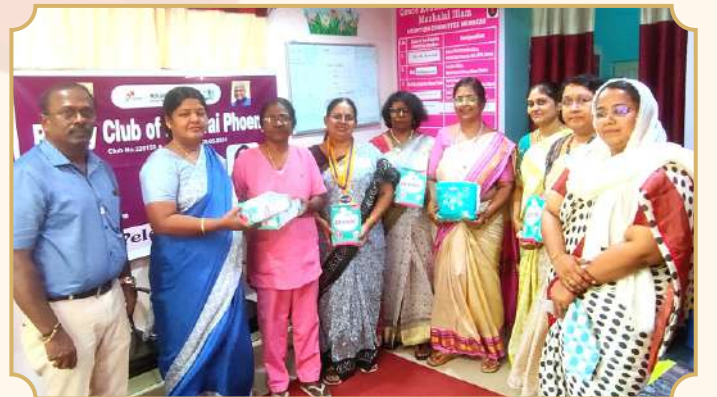
Rotary Club of Madurai Phoenix