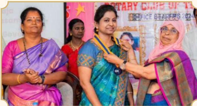
Rotary Club of Theni Star