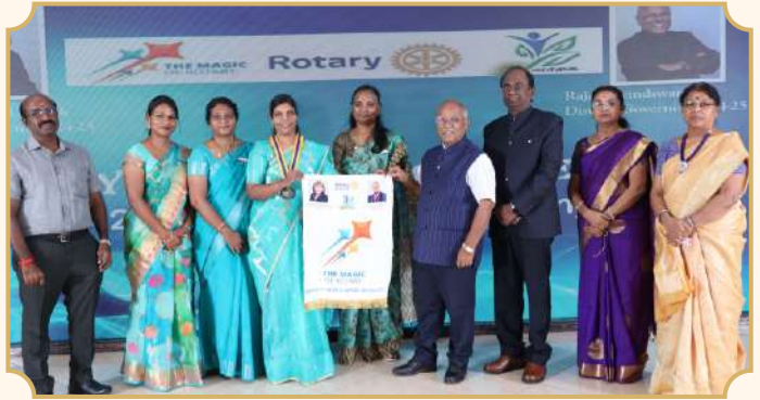
Rotary Club of Dindigul Queen City