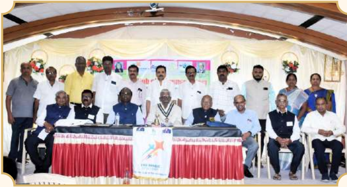
Rotary Club of Thirumangalam