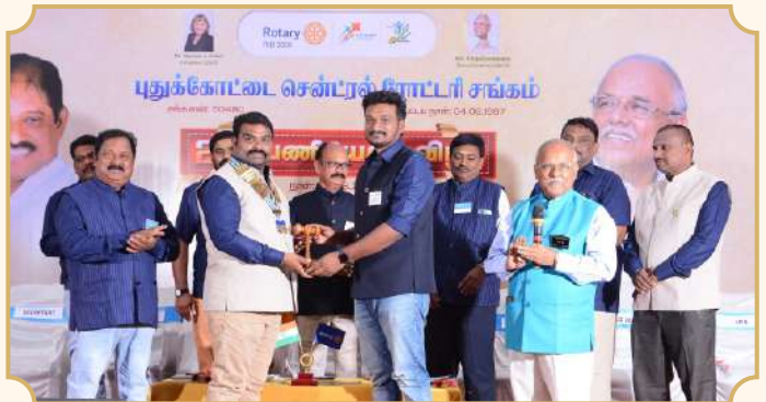
Rotary Club of Pudukottai Central