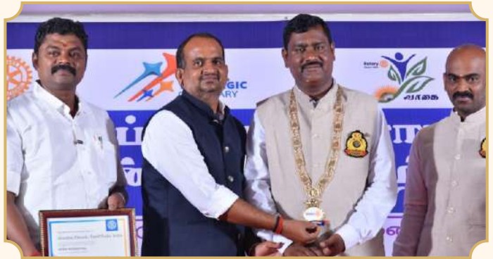
Rotary Club of Aranthai Friends