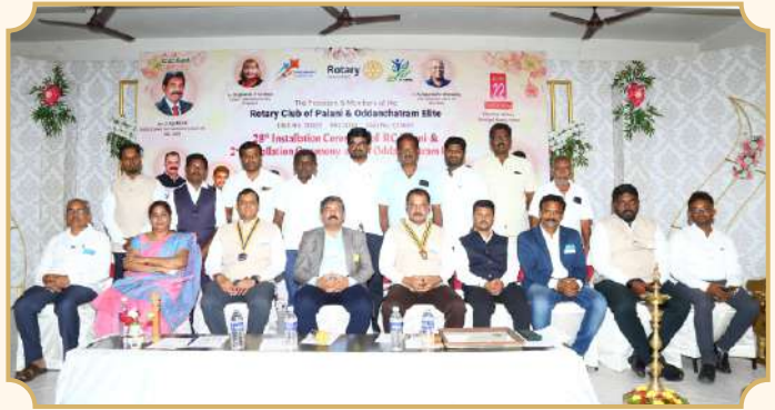
Rotary Club of Palani & Oddanchatram Elite