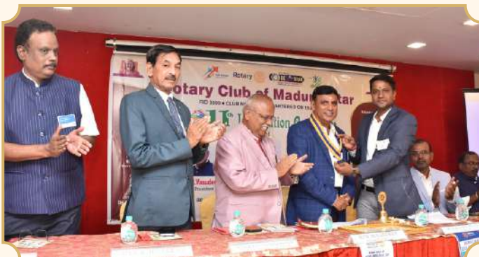
Rotary Club of Madurai Star