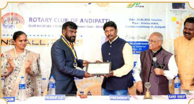
Rotary Club of Andipatti