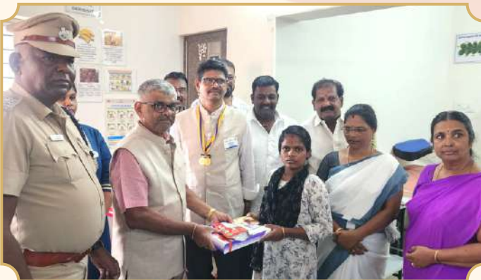
Rotary Club of Madurai Sangamam

தாய் சேய் நலத் தொண்டு தொடர்வோம் மகளிர் சக்தி மேம்பாட்டுத் திட்டம்