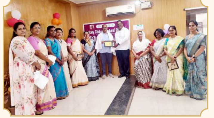
Rotary Club of Madurai Phoenix