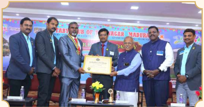
Rotary Club of Tirunagar Madurai