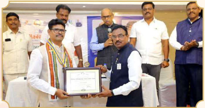
Rotary Club of Madurai Sangamam