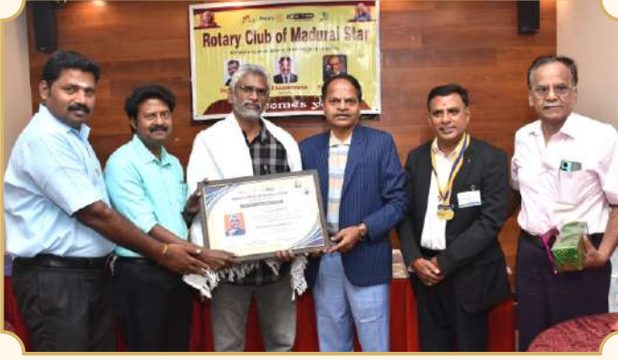
Rotary Club of Madurai Star