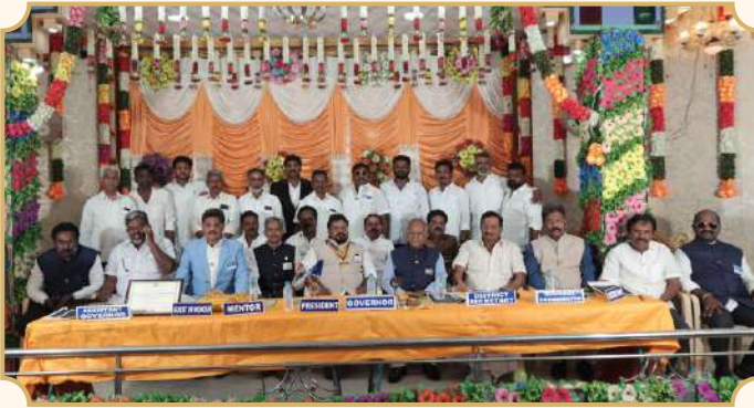
Rotary Club of Chinnamannur Green City