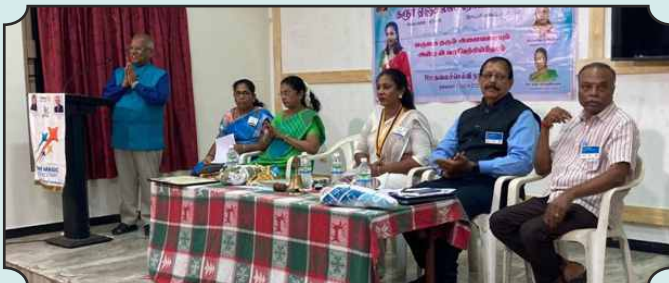
Rotary Club of Karur Angels – 23rd Dec, 2024