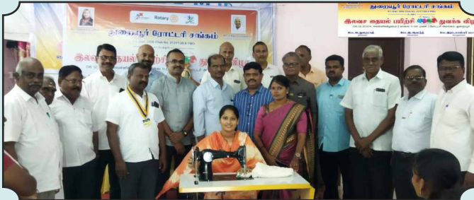
Rotary Club of Thuraiyur Free Tailoring Course Inaugurated on 6th Dec, 2024