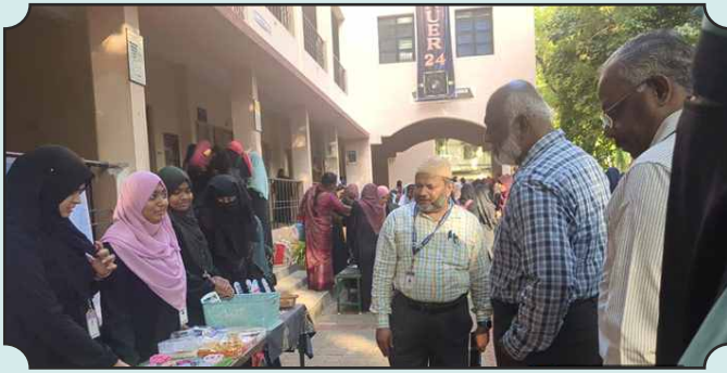
Rotaract Club (Women) of Jamal Mohamed College ROTAPRENEUR '24 Mega Stall Fair on 03.12.2024