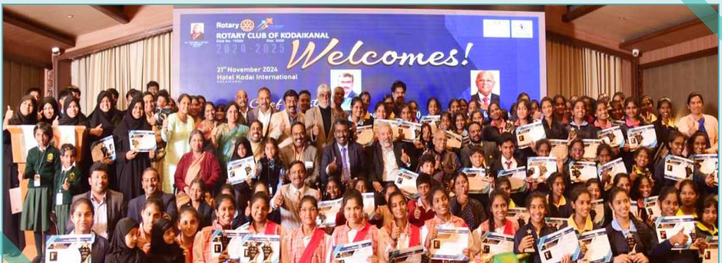
Inter School Multi Talent Competitions Organised by Rotary Club of Kodaikanal with a participation of 1250 students from 24 Schools. 400 plus winners were honoured by RIDE MMM.