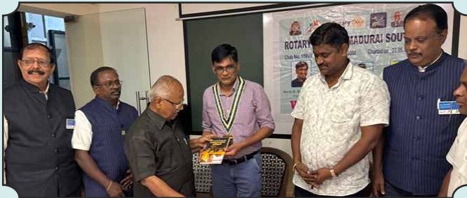
Rotary Club of Madurai South – 15th Dec, 2024