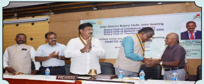
துறையூர் ஒன்றிய சங்கம், மதுரை மிட் டவுன் ரோட்டரி சங்கம், கோயம்புத்தூர் ரோட்டரி சங்கம் - மூன்று சங்கங்களின் கூட்டுக் கூட்டம் கோயம்புத்தூரில் 29 நவம்பர் 2024 நடைபெற்றது.