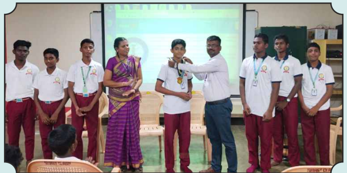
Interact Club of St. Joseph's College Hr Sec School, Trichy Installation Ceremony