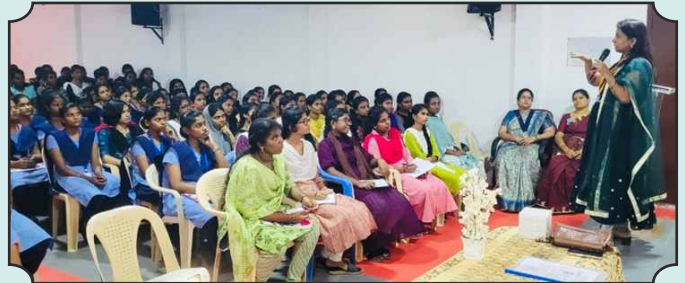
Rotary Club of Theni Stars - Cervical Cancer Vaccine Awareness Project