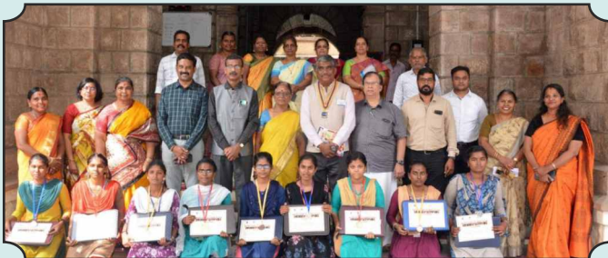
மதுரை மிட் டவுன் ரோட்டரி சங்கம் - சிறார்கள் கொண்டாடும் சித்திரைத் திருவிழா கல்லூரி மாணவர்களுக்கான கவிதை, கட்டுரை, சிறுகதைப் போட்டி