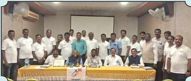
Rotary Club of Karur Wings – 01st Dec, 2024