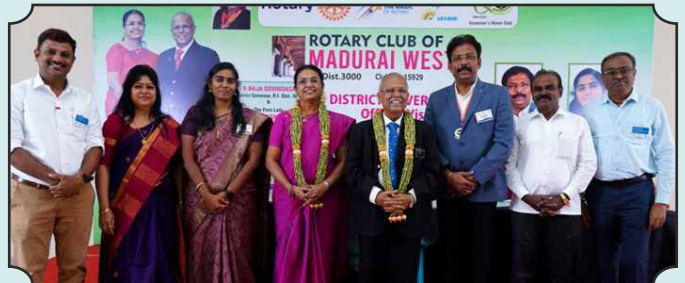
Rotary Club of Madurai West – 20th Dec, 2024