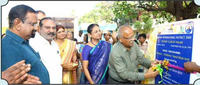
Rotary Club of Palani – Inauguration of Childrens' Hand Wash Unit in Government Middle School, Shanmugapuram, Palani on 18th Dec, 2024