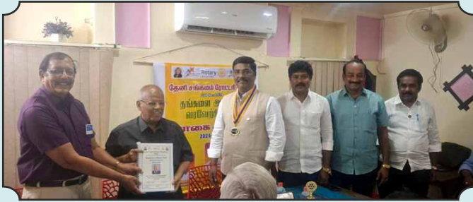
Rotary Club of Theni Sangamam – 14th Dec, 2024