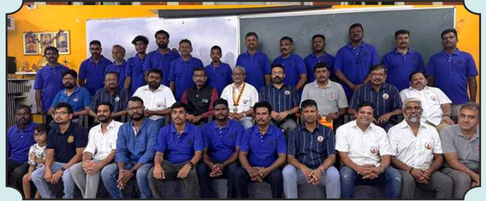
Rotary Club of Madurai Metro Heritage - Rotary Community Corps of Thirumaalpuram running classes for TNPSIC aspirants