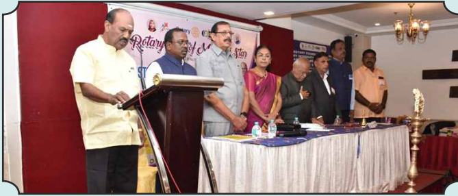
Rotary Club of Madurai Star – 19th Nov, 2024