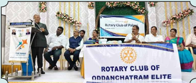
Rotary Club of Oddanchatram Elite – 18th Dec, 2024