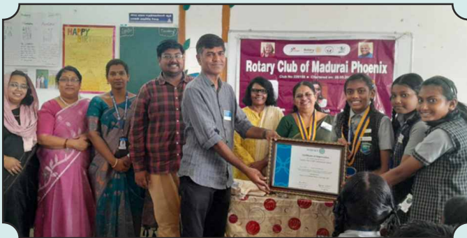
Rotary club of Madurai Phoenix Charter Presentation of New Interact Club in MPF International School