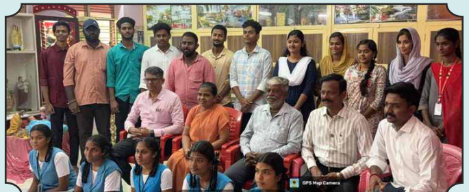
Rotaract Club of Sethu Institute of Technology - Donated a Napkin Incinerator Machine of costing Rs. 15,000/- to St. Antony's Girls Hr Sec School , Koodal Nagar, Madurai on 18th Dec, 2024