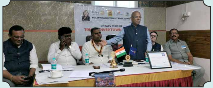
Rotary Club of Trichy River Town – 03rd Dec, 2024