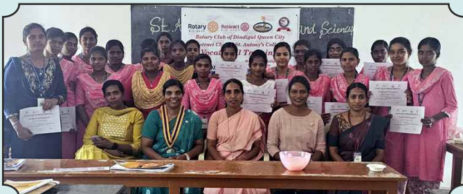
Rotaract Club of St. Antony's College, Dindigul - Vocational Training Course and பரிபூரணி Project to highlight menstrual hygiene along with environmental conservation