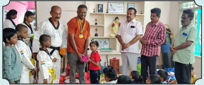
புதுக்கோட்டை சிடி ரோட்டரி சங்கம் - விஜயதாசுமி விழா கொண்டாட்டம்