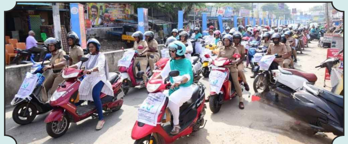
Rotary Club of Dindigul Queencity – Cervical Cancer Awareness Rally on 17th Dec, 2024