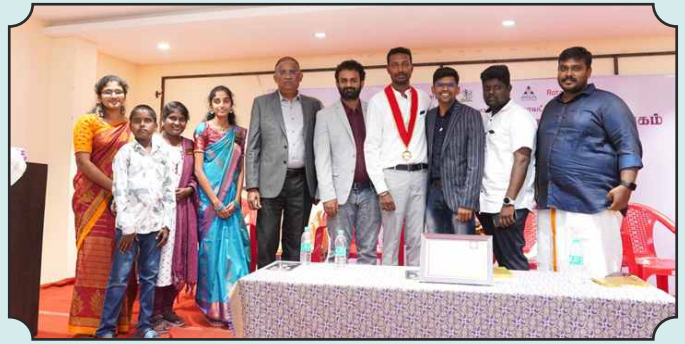
Rotaract Club of Agal 1st Installation Ceremony at Pudukottai 14th Dec, 2024