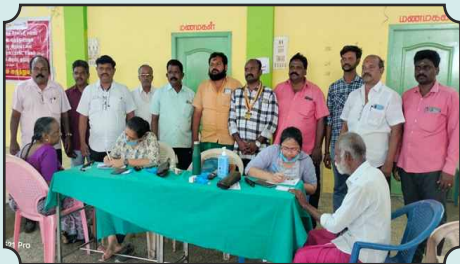
Eye Camp organized by Rotary Club of Thuraiyur Perumal Malai in association with Sankara Nethralaya