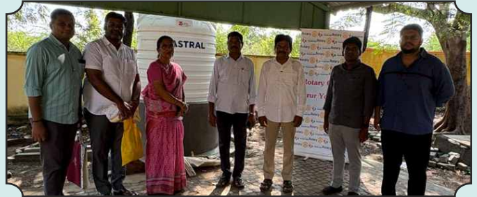
Rotary Club of Karur Young Gen – Sponsored 2000 Lts Syntex Tank at Govt Higher Secondary School, Thamanyakanpatti