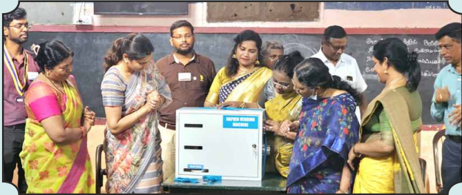
Rotary Club of Trichy, Trichy Next Gen and Trichy Eye Donation - GIFT OF HYGIENE, GIFT OF DIGNITY- Donation of Automatic Sanitary Napkin Vending Machine