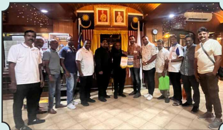
Rotary Club of Tiruchirapalli Diamond City met the Governor of RID 3300. Exchanged flags with Rotary Club of Klang Central - RID 3300 Malaysia