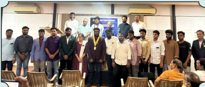
ROTARACT CLUB OF MADURAI PANDYAS CHARTER CLUB INSTALLATION