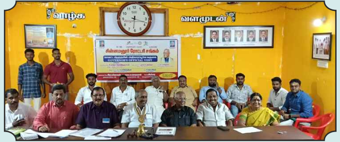
Rotary Club of Chinnamanur – 14th Dec, 2024