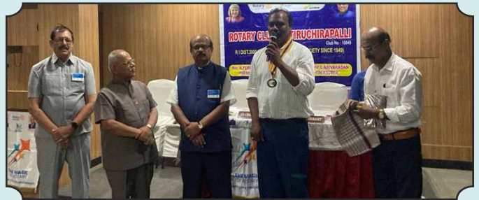
Rotary Club of Tiruchirapalli – 03rd Dec, 2024