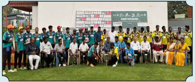
RSA RIDDLE - ROTARACT MULTI DISTRICT CRICKET TOURNAMENT PARTICIPATED BY EIGHT DIFFERENT DISTRICTS – RID RID 3000, 3181, 2982, 3201, 3203, 3020, 3191, 3170.