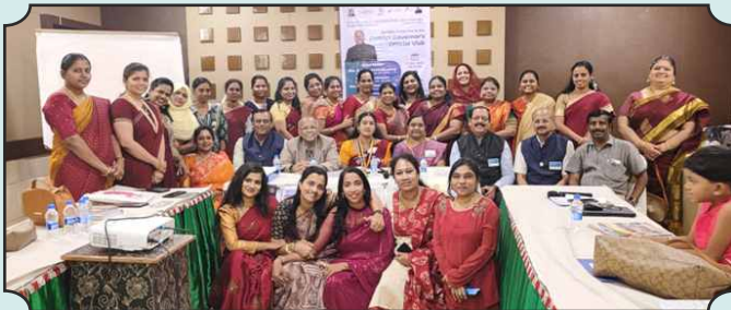
Rotary Club of Trichirapalli Butterflies – 17th Dec, 2024