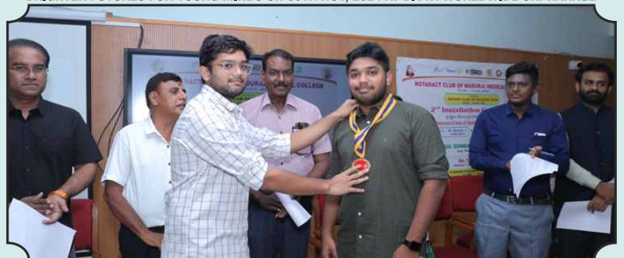
ROTARACT CLUB OF MADURAI MEDICAL COLLEGE 2ND INSTALLATION CEREMONY OF OFFICE BEARERS