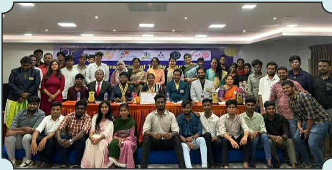
Rotaract Club of Trichy Diamond 1st Installation Ceremony on 17th Nov, 2024