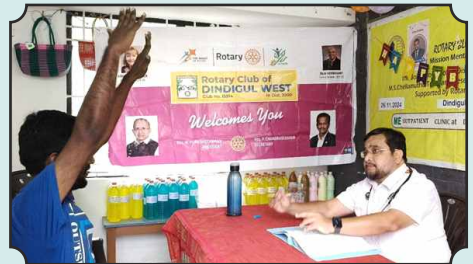
300th Mental Health Camp by Dindigul Blossom Team