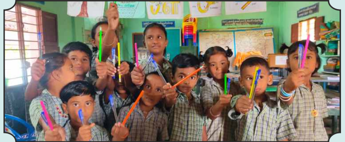
ROTARACT CLUB OF KARUR ARAM – CHILDREN'S DAY CELEBRATIONS @ A PRIMARY SCHOOL IN KARUR – 14TH NOV 2024