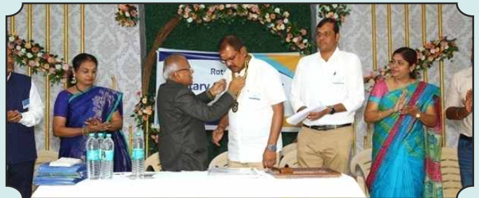
Rotary Club of Palani – 18th Dec, 2024