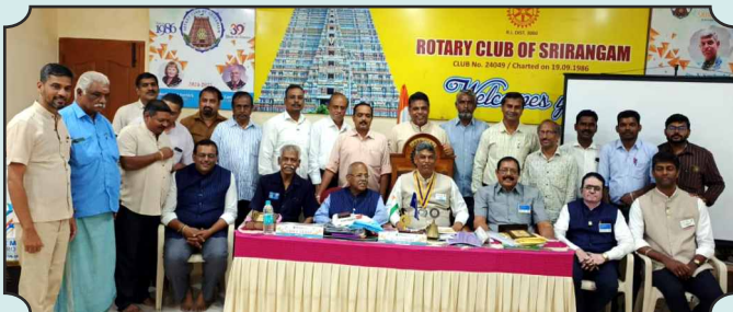
Rotary Club of Srirangam – 03rd Dec, 2024