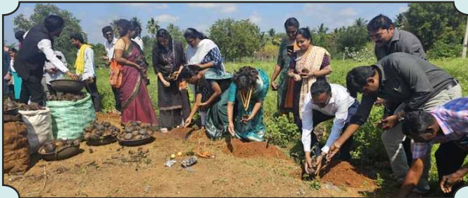
ROTARY CLUB OF DINDIGUL QUEENCITY – PLANTING PALM SEEDS AROUND மொடையன் குளம், கரட்டழகன்பட்டி, திண்டுக்கல் மாவட்டம். on 08th Dec, 2024