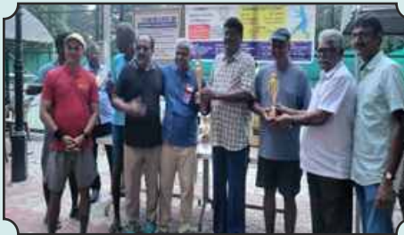
Interclub Tennis Tournament