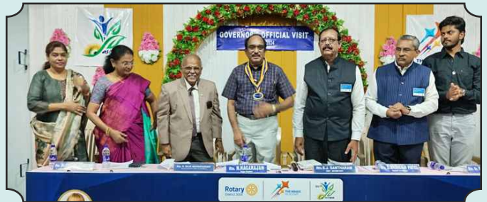
Rotary Club of Dindigul Midtown – 10th Dec, 2024