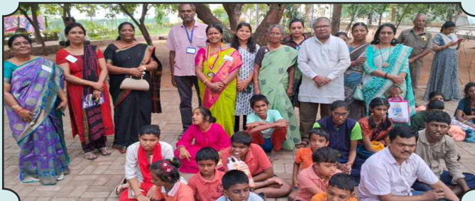
Rotary Club Madurai Malligai Organized the Meeting of otherwise abled Children on 03rd Dec, 2024. at Gandhi Musuem