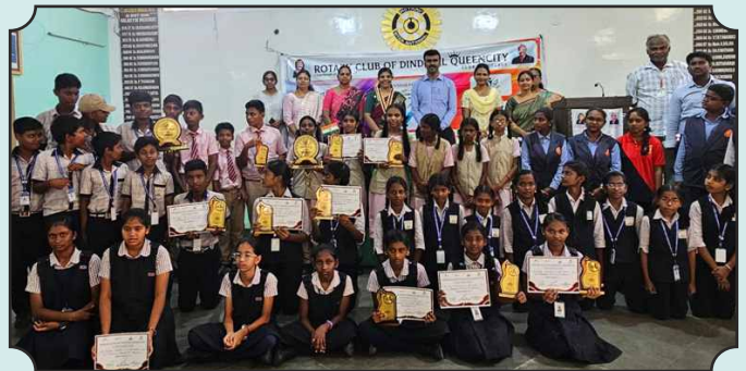
Interact Schools under Rotary Club of Dindigul Queencity showcased their skills in reading through the event "புத்தக சிறகுகள்" and collected Plastic Waste around