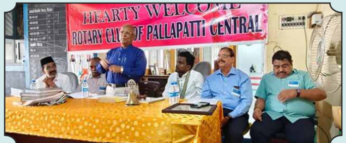
Rotary Club of Pallapatti Central – 23rd Dec, 2024