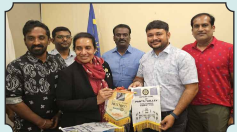
RC of Madurai Next Gen had Joint meeting and exchanged flags with 3 Clubs at Kuala Lumpur, Malaysia RID 3300