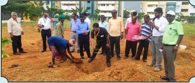
Rotary Club of Jambukeshwaram - Tree Plantation Drive in Trichy Airport