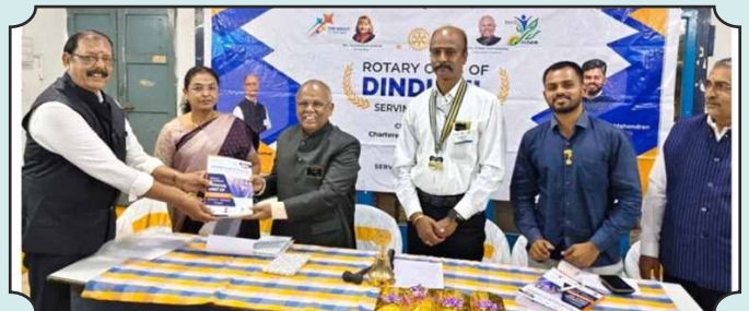
Rotary Club of Dindigul – 11th Dec, 2024