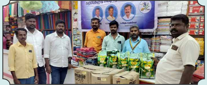
கரம்பக்குடி சிட்டி ரோட்டரி சங்கம் - விழுப்புரம், கடலூர் மாவட்டத்தில் பென்சால் புயல் மற்றும் மழையால் பாதிக்கப்பட மக்கள் நிவாரணப் பொருட்கள் வழங்குதல்.