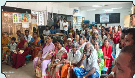
100th Mental Health Camp by RC of Thuraiyur Golden City