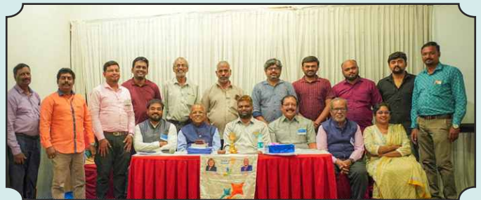
Rotary Club of Trichy Next Gen – 03rd Dec, 2024