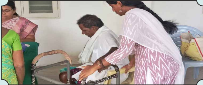
Rotaract Club of Cauvery College, Trichy - Movability Mission Episode 01 at Hindu Mission Hospital Limb Distribution Program – 24th Nov, 2024