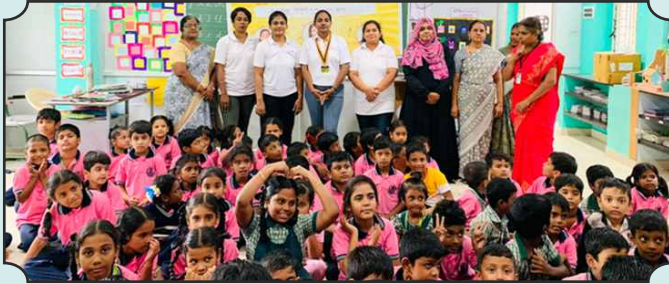
Rotary Club of Trichy Diamond City Queens - Global Hand Wash Day for Municipal Urudu Primary School and Methodist Girls Higher Secondary School