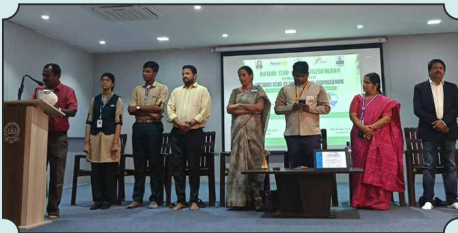
Interact Club of Sri Vaghvesha Vidhyashram School, Srirangam New Club Inauguration by RC of Jumbukeshwaram