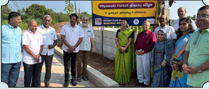
ROTARY CLUB OF MADURAI WEST - Inauguration of Miyawaki Forest “ஆனந்தத்தின் தோட்டம்” Thenur, Near Sholavandan, Madurai.