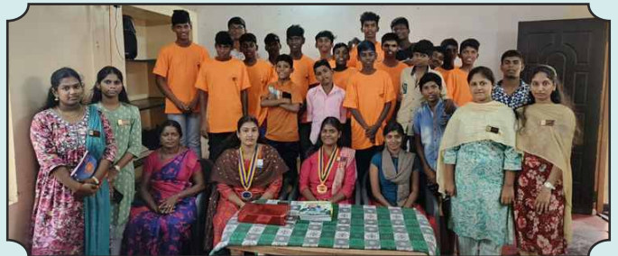
ROTARACT CLUB OF TIRUCHIRAPALLI YARA - TWO-MONTH PROGRAM FOR ORPHAN STUDENTS (CLASSES 3-8), FOCUSING ON EDUCATION, SKILL-BUILDING, AND HOLISTIC DEVELOPMENT, FOSTERING BRIGHTER FUTURES FOR YOUNG MINDS ON 30TH NOV, 2024 AT DIVYA WORLDWIDE ORPHANAGE