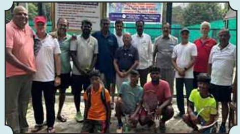
Junior Students Tennis Tournament