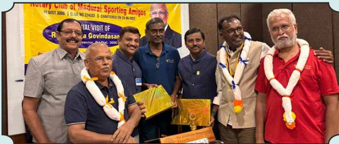
Rotary Club of Madurai Sporting Amigos – 24th Nov, 2024