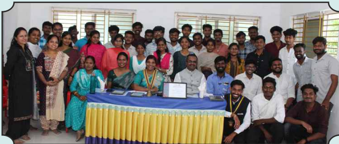
ROTARACT CLUB OF DINDIGUL ROCKFORT 13TH INSTALLATION ALONG WITH 2000 NOS PALM SEEDS PLANTION – 08TH DEC, 2024