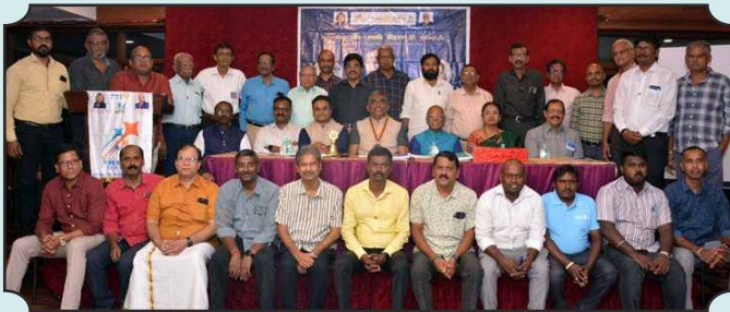
Rotary Club of Madurai Mid-Town – 28th Nov, 2024