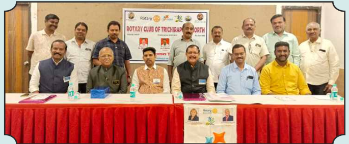
Rotary Club of Trichirapalli North – 16th Dec, 2024