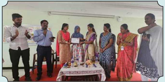
Rotaract Club of St. Antony's College, Dindigul Installation on 11th Dec, 2024