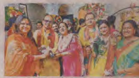
श्याम बहादुर मंदिर परिसर में जन्माष्टमी उत्सव मनाते सदस्य।