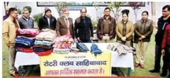
रोटरी क्लब साहिबाबाद ने जेल में बंदियों को कंबल और जैकेट वितरित कीं

रोटरी क्लब साहिबाबाद ने जेल में बंदियों को कंबल और जैकेट वितरित कीं... (Text describes the social service activity by the Rotary Club)