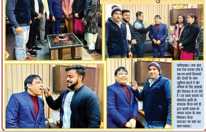
लोकहित क्रांति के पत्रकारों ने नववर्ष की पावन बेला पर खुशियों की बौछार की

लोकहित क्रांति के पत्रकारों ने नववर्ष की पावन बेला पर खुशियों की बौछार की... (Text mentions the celebration of New Year by the newspaper staff)